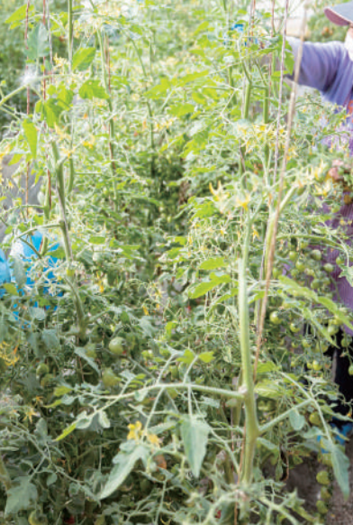
3月20日,在宁夏银川市贺兰县习岗镇新平设施农业园区瑞信果蔬农业温棚内,农民为小番茄打叉。当日是二十四节气中的春分,各地农民抢抓农时开展农事活动,田间地头一派繁忙景象。

中国农业发展银行有关负责人表示,综合运用现有信贷产品,优化信贷流程,加强产业链供应链金融创新,推动小微信贷业务顺利运行,为小微企业提供多元化、特色化、差异化的金融服务。要在客户准入、办理流程以及贷款定价等环节用好用足普惠小微企业信贷优惠政策,更要积极探索创新小微企业支持模式。