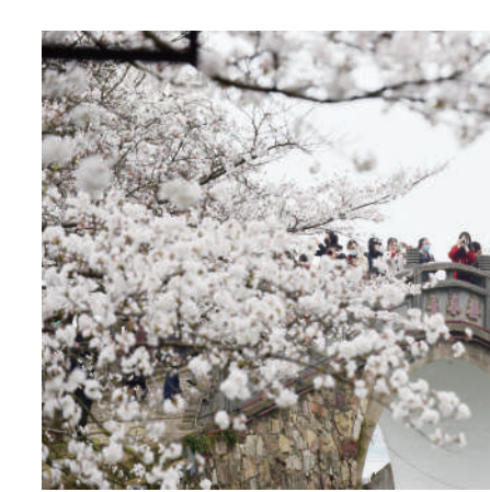
3月19日,游客在江苏省无锡市太湖鼋头渚景区欣赏盛开的樱花。春分时节,人们在温暖和煦的春风中踏青、赏花,乐享春日美景。

在气象学上,春分前后我国大部分地区正式入春。“自春分日起,我国除青藏高原、东北、西北和华北北部地区外,大部分地区连续5天日平均气温超过10摄氏度。小草返青,柳树发育,燕子也从南方飞向北方,气象学意义上的春天降临在广袤的神州大地。”南京信息工程大学应用气象学院副教授江晓东说。