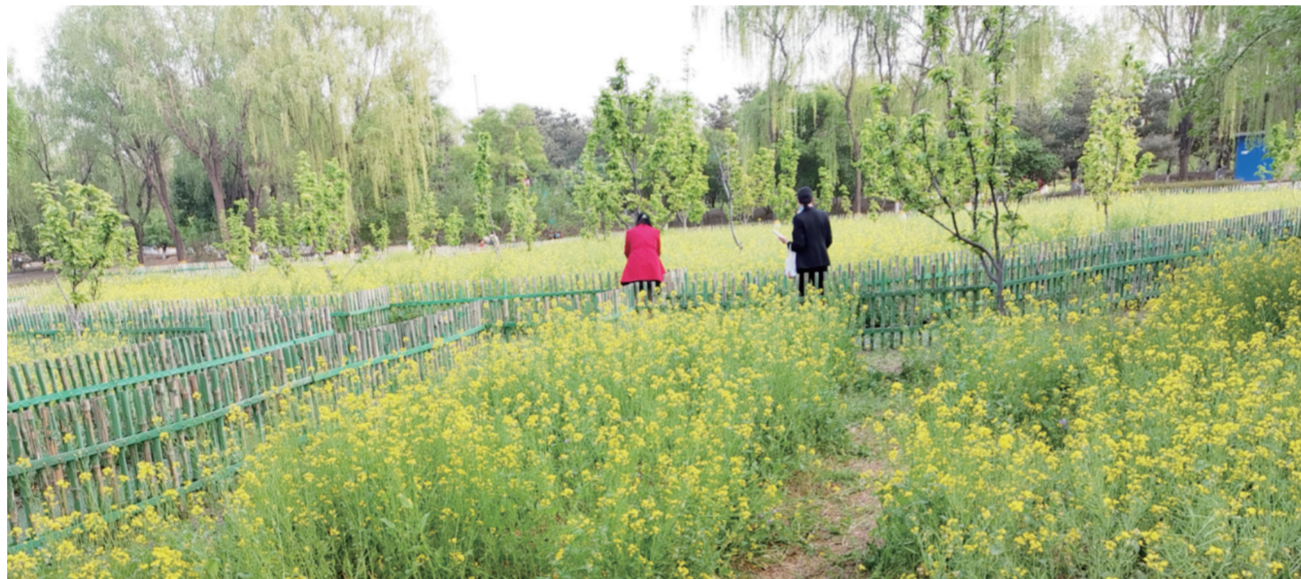
4月23日，北京郊区油菜花盛开，市民纷纷走出家门到这打卡游览。

本次活动以火星为主题，包括“未来火星基地”“火星新手村”“火星竞技场”“火星农场”四大板块。走进中国科技馆一层大厅，观众就能看到“未来火星基地”内按比例展示的火星奥林帕斯山和水手峡谷，以及置身其间的“祝融号”“勇气号”等火星车的1:1模型、科考装置和地下城模型。