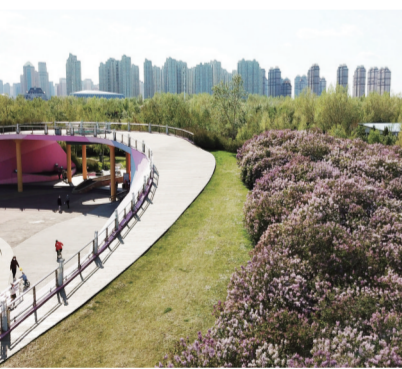
这是5月7日在哈尔滨丁香公园拍摄的丁香花。近日，哈尔滨市迎来丁香赏花季。丁香花是哈尔滨的市花，盛开的丁香扮靓城市，满园芬芳。

公安部交管局相关负责人表示，当前我国疫情防控工作正处于关键时期，各地公安交管部门将结合本地实际，继续推行便民利民措施，服务保障物流畅通，全力维护正常生产生活秩序。