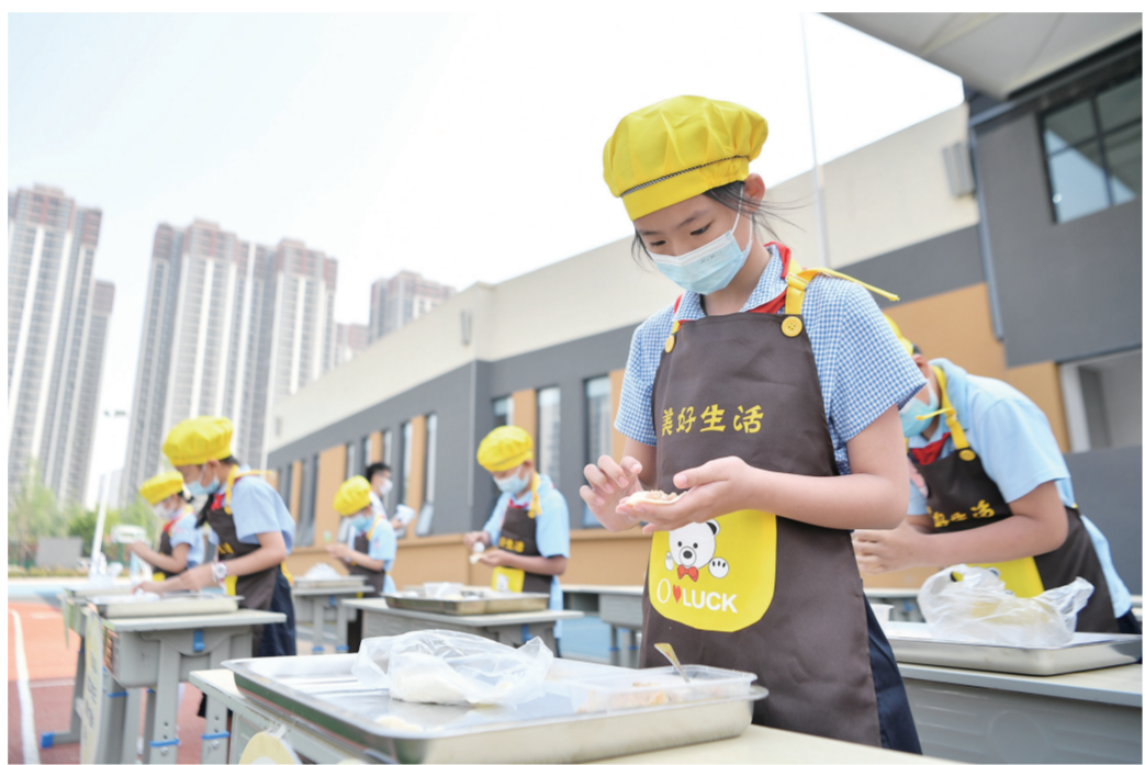
5月7日，西安市后宰门小学的学生参加包饺子比赛。5月7日，一场以“美好双手，美好生活”为主题的劳动技能大赛在西安市后宰门小学幸福校区举行。来自不同年级的学生分别参加叠衣服、包饺子、缝扣子、削果皮等项目的比赛。“双减”政策落地以来，西安市后宰门小学积极开展劳动教育与实践，通过多元化课程、生活化课堂培养学生的动手能力，促进学生体验劳动乐趣，增强劳动意识。