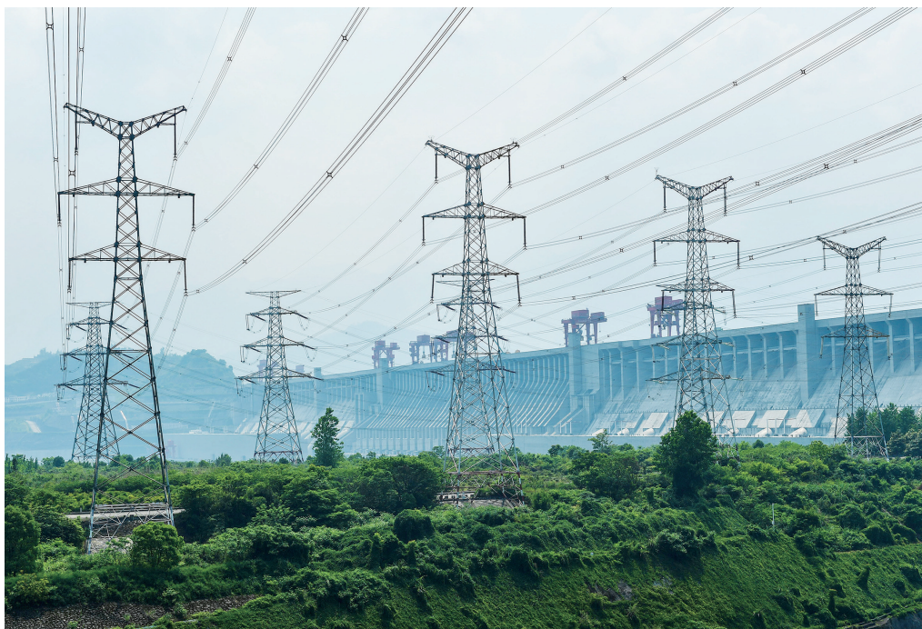
5月8日拍摄的三峡大坝及左岸电站外输电线路。

据中国三峡集团消息,截至5月4日,三峡集团长江干流乌东德、白鹤滩、溪洛渡、向家坝、三峡、葛洲坝6座梯级水电站多年累计发电量突破3万亿千瓦时。目前,6座梯级水电站已投产的发电机组为101台,装机总量为6200多万千瓦,约占全国水电装机容量容量的16%。