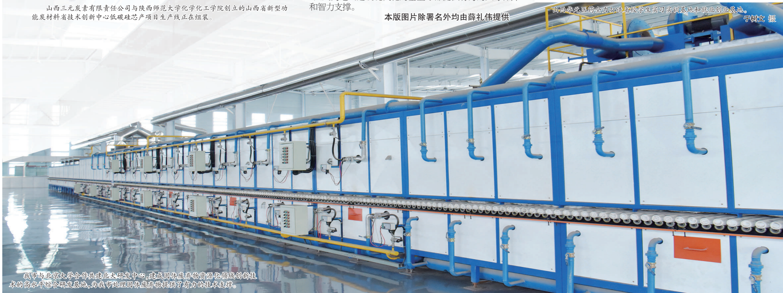
我市与北京大学合作共建北大研发中心,建成固体废物资源化领域创新技术的高水平综合研发基地,为我市处理固体废物提供了有力的技术支持。