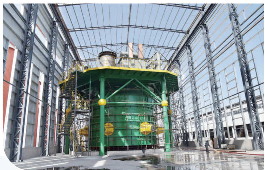
山西三元炭素有限责任公司与陕西师范大学化学化工学院创立的山西省新型功能炭材料省技术创新中心低碳硅芯产项目生产线正在组装。