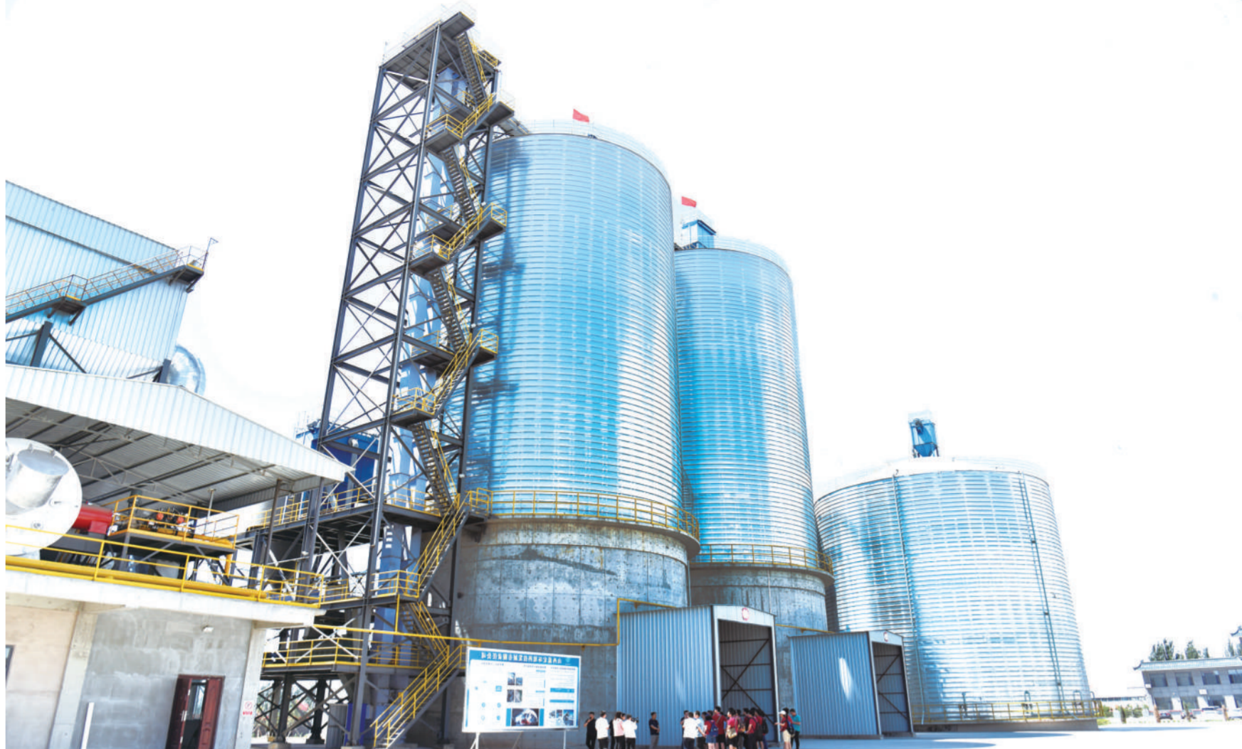
山西蕴宏科技发展有限公司引进北京科技大学科研成果已建成年产50万吨低碳高性能混凝土胶凝加固材料生产线。