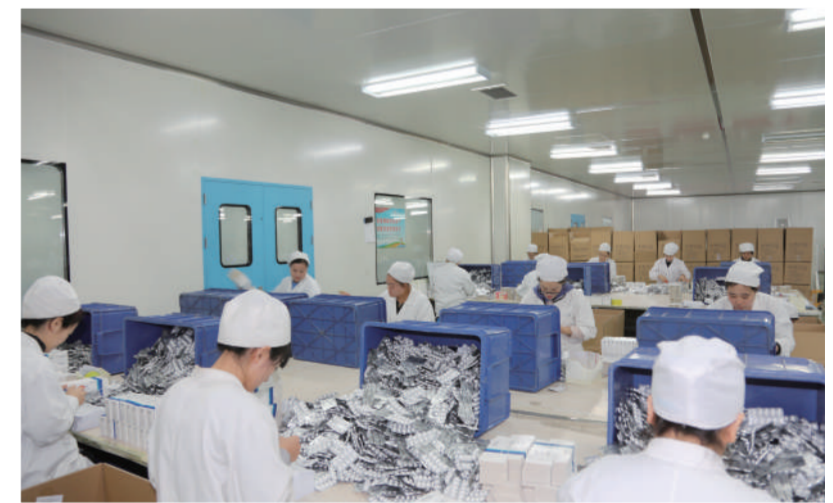
山西华元医药全力打造省校学生实习实训基地和就业创业基地。