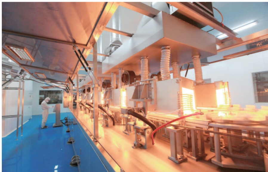
山西省科技成果转化示范企业——诺成制药大输液吹瓶机生产线。