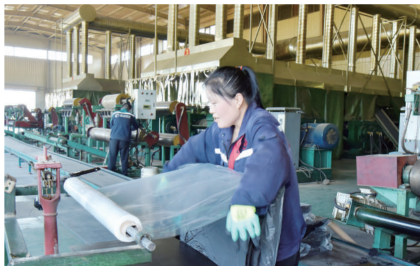
山西金胜达环保科技有限公司引进湖北工业大学科研技术推动橡胶产品的循环利用,延伸产业链。