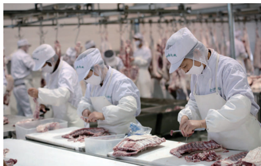
怀仁市金沙滩羔羊肉股份有限公司成为中国农业大学农产品供应基地。