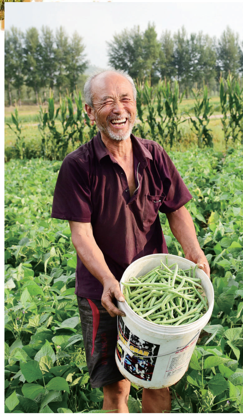
应县小石村地豆种植区