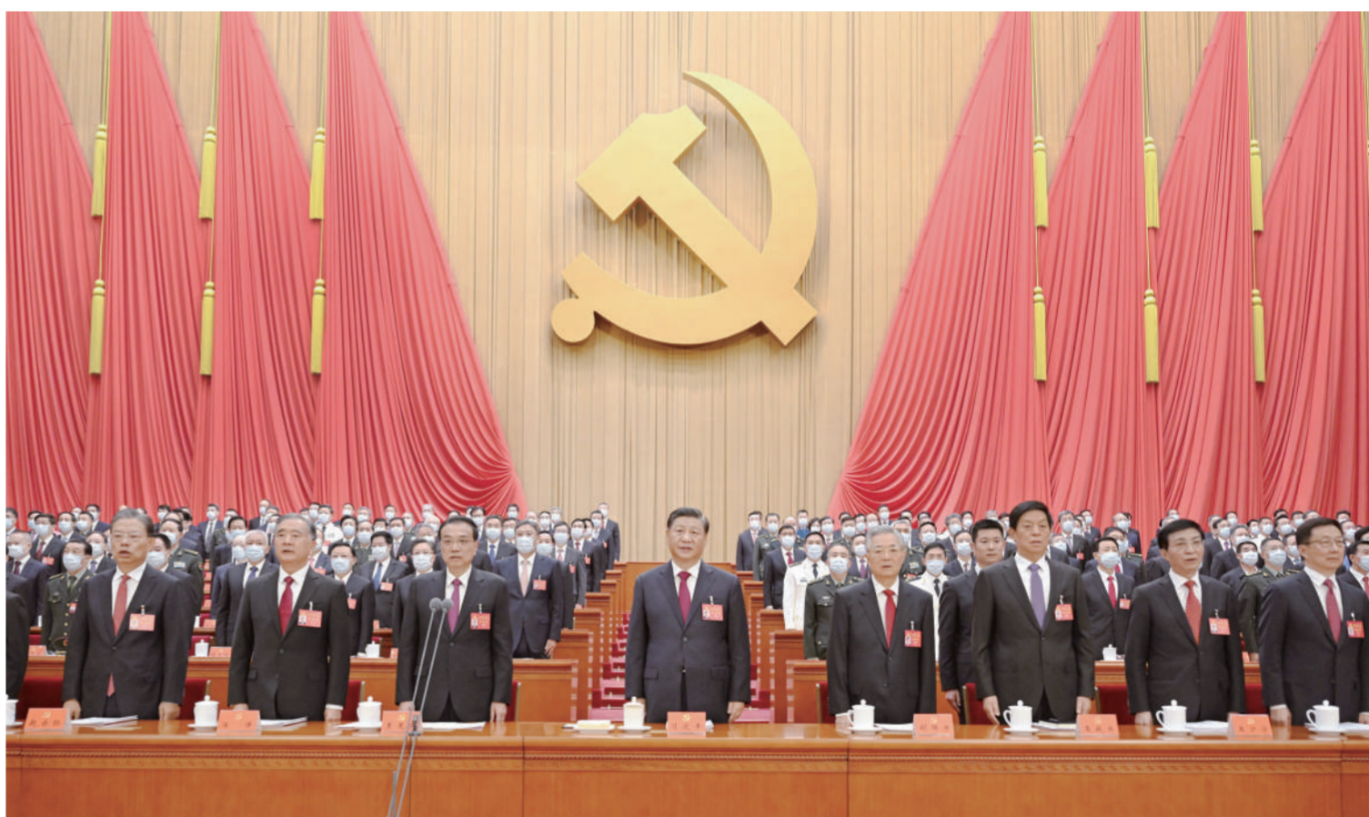
10月16日,中国共产党第二十次全国代表大会在北京人民大会堂开幕。这是习近平、李克强、栗战书、汪洋、王沪宁、赵乐际、韩正、胡锦涛在主席台上。

新华社北京10月16日电 凝心聚力擘画复兴新蓝图,团结奋进创造历史新伟业。举世瞩目的中国共产党第二十次全国代表大会16日上午在人民大会堂开幕。 习近平代表第十九届中央委员会向大会作了题为《高举中国特色社会主义伟大旗帜 为全面建设社会主义现代化国家而团结奋斗》的报告。习近平指出,中国共产党第二十次全国代表大会,是在全党全国各族人民迈上全面建设社会主义现代化国家新征程、向第二个百年奋斗目标进军的关键时刻召开的一次十分重要的大会。大会的主题是:高举中国特色社会主义伟大旗帜,全面贯彻新时代中国特色社会主义思想,弘扬伟大建党精神,自信自强、守正创新,踔厉奋发、勇毅前行,为全面建设社会主义现代化国家、全面推进中华民族伟大复兴而团结奋斗。 人民大会堂雄伟庄严,万人大礼堂气氛热烈。主席台上方悬挂着“中国共产党第二十次全国代表大会”的会标,后幕正中是镰刀和锤头组成的党徽,10面鲜艳的红旗分列两侧。二楼和三楼阳台上分别悬挂着“高举中国特色社会主义伟大旗帜,全面贯彻新时代中国特色社会主义思想,弘扬伟大建党精神,为全面建设社会主义现代化国家、全面推进中华民族伟大复兴而团结奋斗!”“伟大、光荣、正确的中国共产党万岁!”的横幅。 在主席台前排就座的大会主席团常务委员会成员有习近平、李克强、栗战书、汪洋、王沪宁、赵乐际、韩正、丁薛祥、王晨、刘鹤、许其亮、孙春生、李希、李强、李鸿忠、杨洁篪、杨晓渡、张又侠、陈希、陈全国、陈敏尔、胡春华、郭声琨、黄坤明、蔡奇、胡锦涛、李瑞环、温家宝、贾庆林、张德江、俞正声、宋平、李岚清、曾庆红、吴官正、李长春、贺国强、刘云山、张高丽、刘权、张庆黎。