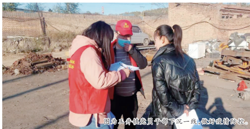
因为玉井镇党员干部下沉一线，做好疫情防控。