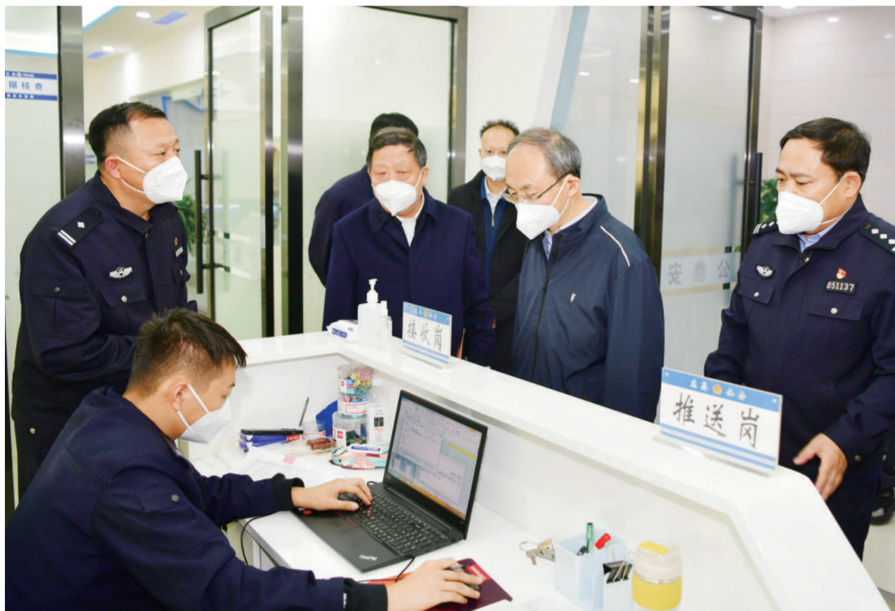
11月17日至20日，省委常委、政法委书记郑连生（右二）深入朔州市，调研基层治理、平安建设、疫情防控等工作。

本报讯（记者 赵娟娟）11月17日至20日，省委常委、政法委书记郑连生深入朔州市，调研基层治理、平安建设、疫情防控等工作。市委书记姜四清，省卫健委副主任阴彦祥，市领导宋红波、王琳玉、田东、魏元平、袁小波等参加。郑连生强调，要坚持以习近平新时代中国特色社会主义思想为指导，深入学习贯彻党的二十大精神，深入贯彻习近平总书记关于政法工作的重要论述，坚持党对政法工作的绝对领导，不断夯实社会治理基层基础，以快制快开展疫情防控应急处置，维护政治社会大局安全稳定，探索朔州特色治理路径，为全方位推动高质量发展营造良好法治社会环境。郑连生先后来到朔城区北城街道