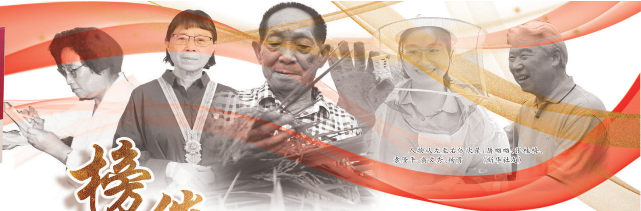
人物从左至右依次是：屠呦呦、张桂梅、袁隆平、黄文秀、杨贵