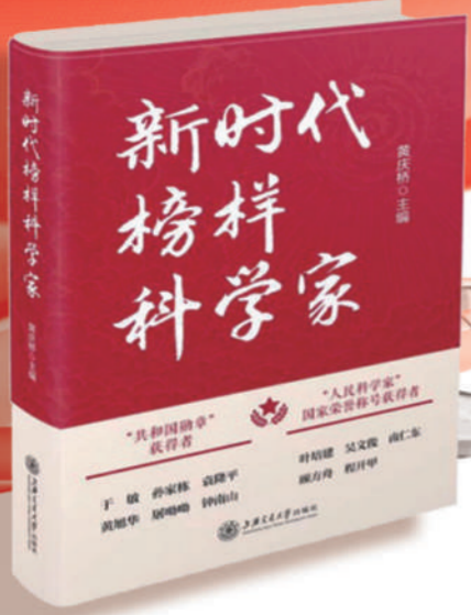
《新时代榜样科学家》 主编：黄庆桥 出版社：上海交通大学出版社