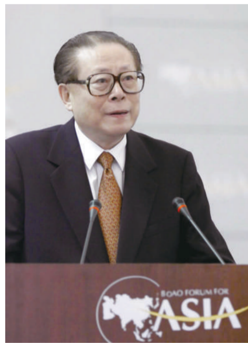
上图：2001年2月27日，博鳌亚洲论坛成立大会在海南举行。江泽民同志出席成立大会并致辞。