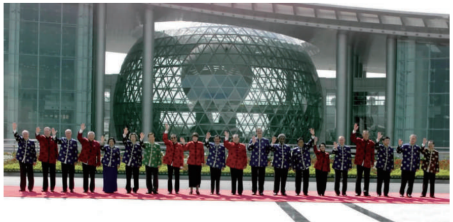
左图：2001年10月21日，亚太经合组织第九次领导人非正式会议在上海举行。这是江泽民同志与参会的经济体领导人合影。