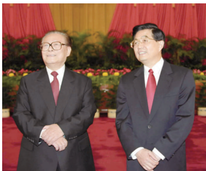
左图：2002年11月15日，江泽民同志、胡锦涛同志在北京人民大会堂亲切会见出席党的十六大代表、特邀代表和列席人员并发表重要讲话。