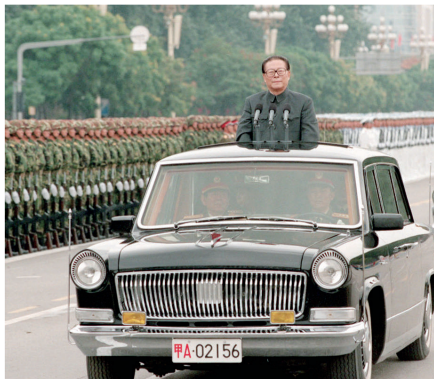
左图：一九九九年十月一日，中华人民共和国成立五十周年盛大庆典在北京天安门广场举行。江泽民同志检阅由人民解放军陆海空三军和人民武装警察部队、民兵预备役部队组成的地面方阵。