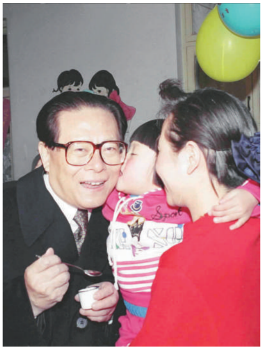
右图：1993年12月5日，江泽民同志在北京为一位幼儿园儿童喂服脊髓灰质炎疫苗后，小朋友亲吻江爷爷。