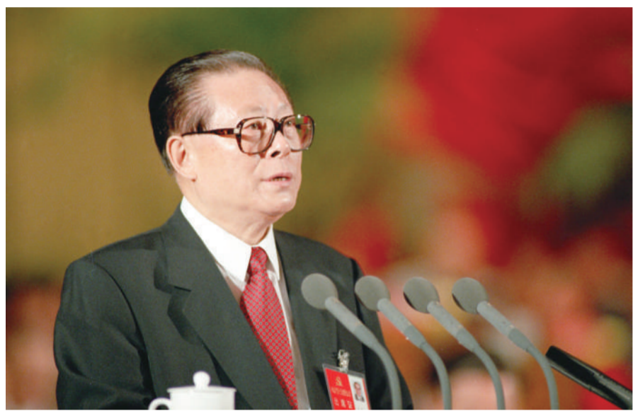
上图：1997年9月12日，中国共产党第十五次全国代表大会在北京人民大会堂开幕。这是江泽民同志代表第十四届中央委员会作报告。