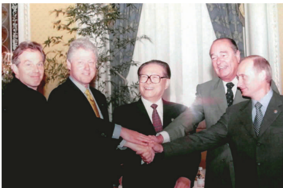
左图：2000年9月7日，由联合国安理会五个常任理事国首脑会议在纽约举行。江泽民同志（中）同法国总统希拉克（右二）、俄罗斯总统普京（右一）、英国首相布莱尔（左一）、美国总统克林顿（左二）握手合影。