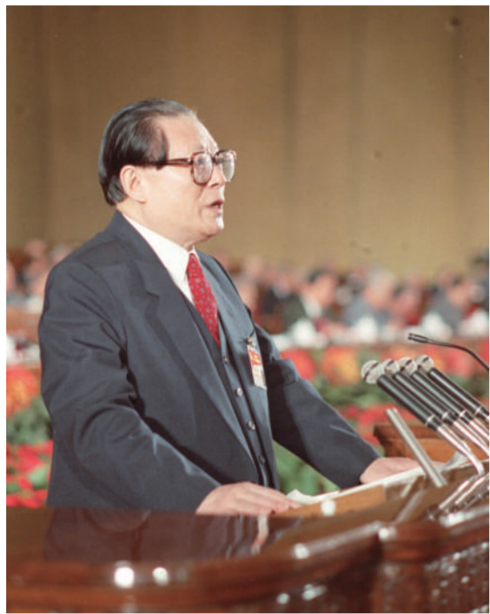
左图：1992年10月12日，中国共产党第十四次全国代表大会在北京人民大会堂开幕。这是江泽民同志代表第十三届中央委员会作报告。