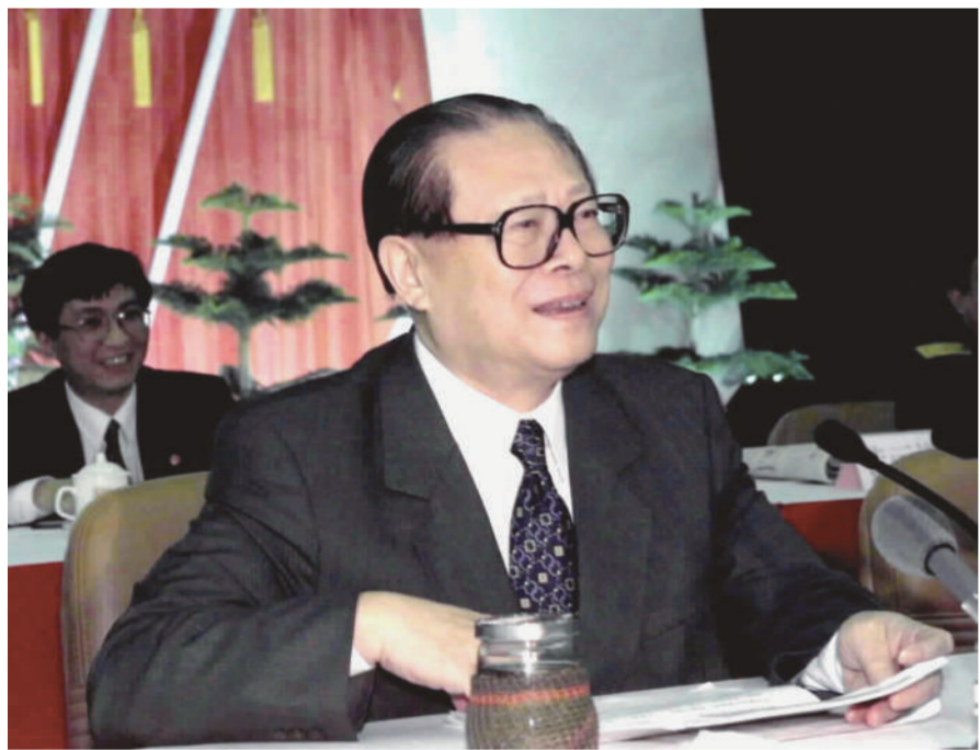
上图：2000年2月20日，江泽民同志在广东省高州市领导干部“三讲”教育会议上发表重要讲话。在这次广东考察中，江泽民同志提出，我们党总是代表着中国先进生产力的发展要求，代表着中国先进文化的前进方向，代表着中国最广大人民的根本利益。