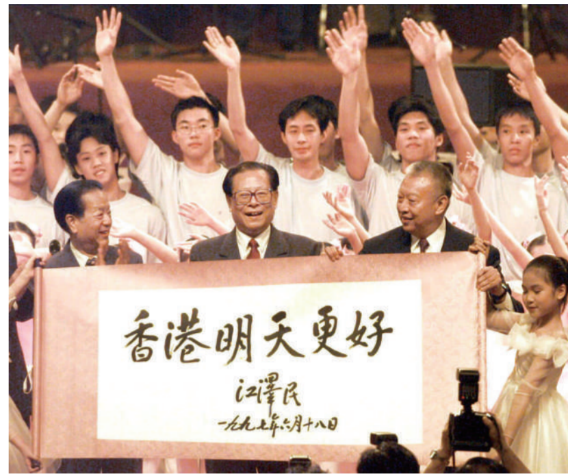
右图：1997年7月1日上午10时，中华人民共和国香港特别行政区成立庆典在香港会展中心新翼举行。在庆典仪式上展示了江泽民同志亲笔题写的“香港明天更好”书法卷轴。