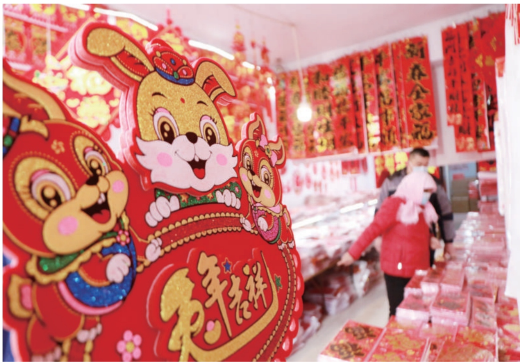
12月18日,在山东省高密市夏庄镇东李村春联批发销售点,客商在挑选春联产品。随着新年的临近,各地年货市场日渐红火。