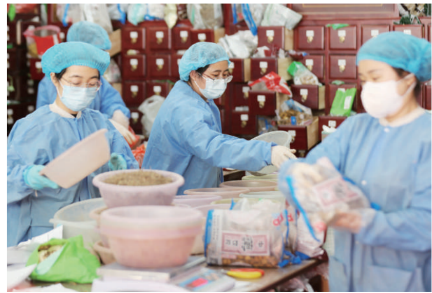
12月19日,山东省临沂市沂南县中医医院的医务人员为市民配制中药。近期,山东省临沂市沂南县许多市民来到中医医院,通过穴位贴敷、艾灸、拔罐、针灸等传统中医疗法,增强身体抗病能力,达到防治疾病的目的。

国药集团发挥全产业链优势,部署旗下160余家医药工业企业24小时保供增产,疫情防控重点品种产能已经扩大到日常的3倍,同时大批量投放零售终端。国药控股、国药股份等企业加班加点协调厂家,备货酚麻美敏口服制剂、布洛芬口服制剂等药品及口罩、隔离衣、抗原检测试剂等物资,并与各大医院24小时沟通需求,最大限度地保障医疗物资供应。