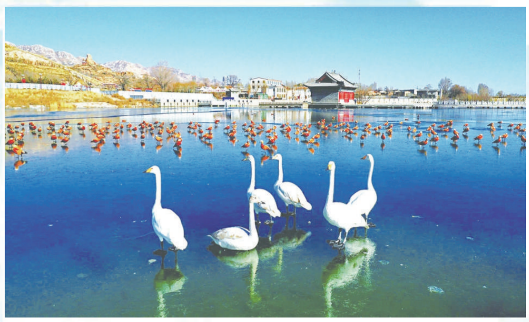
塞上西湖神头海，美丽天鹅来做客。

经济发展更加绿色、攻坚成效更加显著、治理能力更加全面，朔州探索出了一条具有时代特征、特色的生态优先、绿色发展之路，交出了一份令人满意的朔州答卷。