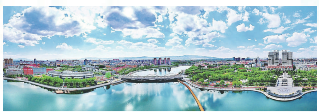
水清岸绿七里河，门神故里好风光。