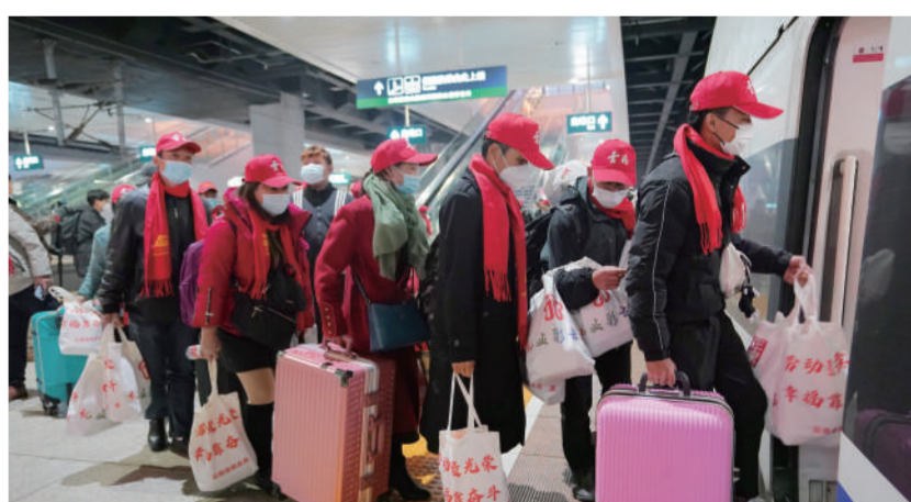
1月30日,务工人员从昆明南站登上动车。当日,来自云南省多地的370多名务工人员在昆明南站免费搭乘动车前往广东返岗务工。

此外,生活必需品消费保持稳定增长,春节假期,粮油食品等基本生活类商品销售收入同比增长31.5%。家居升级类商品消费增长较快,家具、五金、文体用品销售收入同比分别增长15.2%、8.6%和20.9%。