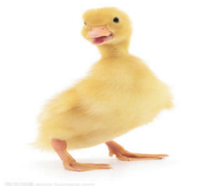
我喜欢我的小黄鸭——球球,它总会给我带来快乐! 朔城区四中六(7)班 李灵丹(本报小记者)

看着它可爱的样子,我的心都快被它萌化了。“不行,我还得干正事”。我在心里说。然后我飞快地朝它后面跑去,一边跑一边从口袋里拿出更多的吃的放在手中,球球笨拙地转过身看到了比原来更多的食物,更加兴奋了,它一个“饿虎扑食”扑向了食物,眼看就要过来了,我见势不妙,立刻抽走了手。球球生气地叫喊着,斜着眼睛看着我,用它那神奇的威力把我给震慑住了。并且在我发愣的时候,向我手中的食物扑了过来,等我反应过来时,手中的食物已经被它一扫而光。唉,球球你为了食物真是什么都干出来呀!