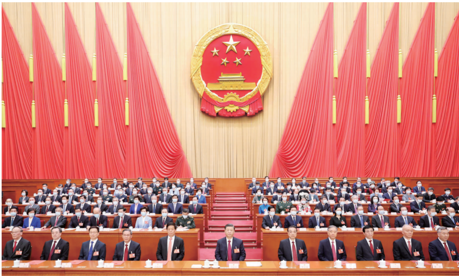
3月13日,第十四届全国人民代表大会第一次会议在北京人民大会堂闭幕。习近平等党和国家领导人在主席台就座。

新华社北京3月13日电 中华人民共和国第十四届全国人民代表大会第一次会议,在圆满完成各项议程,产生新一届全国国家机构组成人员后,13日上午在北京人民大会堂闭幕。