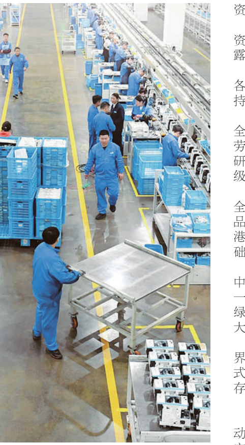
3月23日,在浙江台州杰克科技股份有限公司,工作人员在装配车间装配缝纫机。