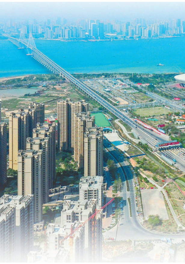
2月28日,广湛铁路湛江湾海底隧道盾构区间“过海穿城”(无人机照片)。