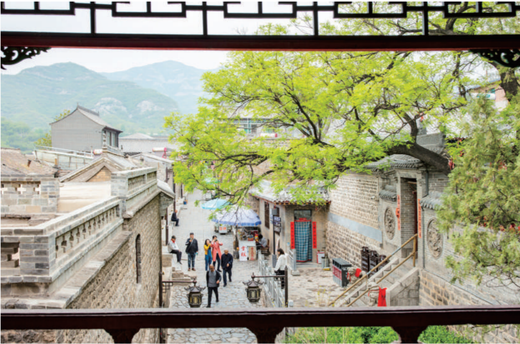
游客在平定县娘子关村游玩(2021年4月21日摄)。