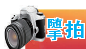
春天,为四月的朔州打开了“万花筒”,公园里,阡陌小路,蜿蜒曲折,百花次第开放,争相吐艳。信步的游人,似乎也被这多彩的春天陶醉,想要留住这份盎然的诗意。