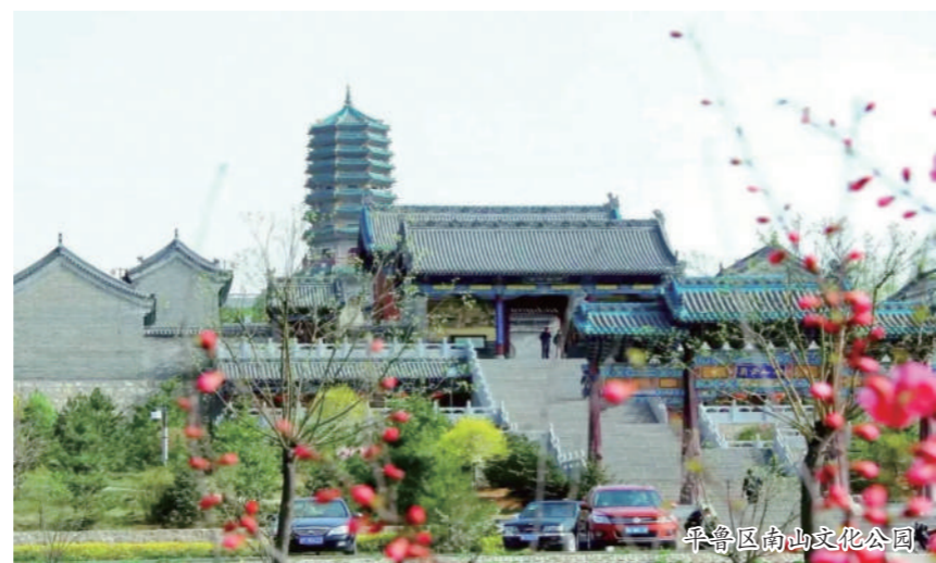
平鲁区南山文化公园