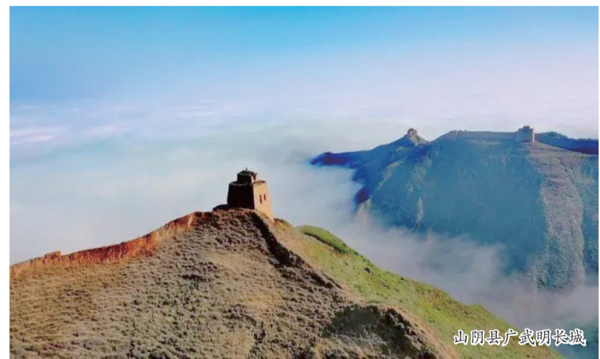
山阴县广武明长城