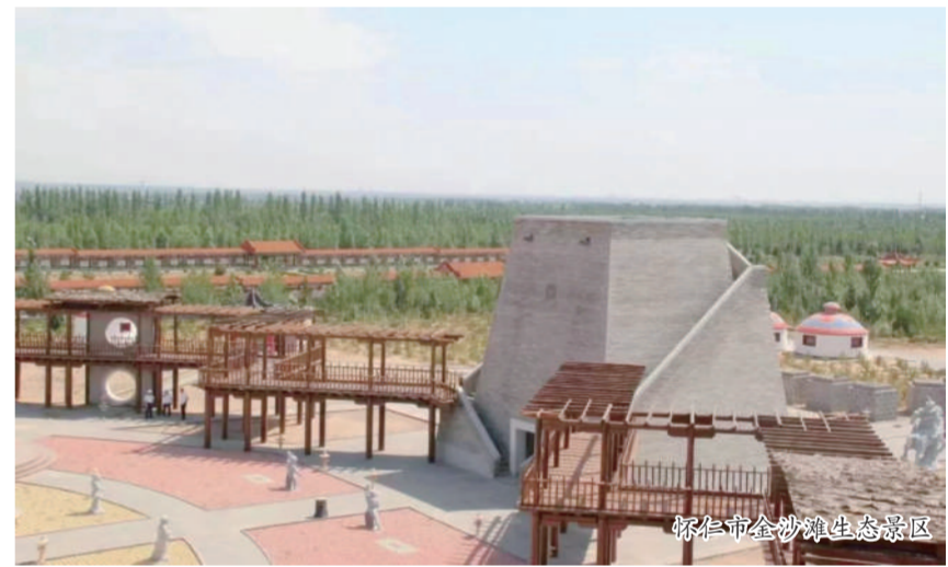
怀仁市金沙滩生态景区

走在佛殿庙的院子里，整齐的青砖红柱，与院内的苍松呼应。殿内的建筑、壁画，则是“修旧如旧”，被岁月雕刻的斗拱，被玻璃罩保护的壁画，都让来者感到震撼。(下转第3版)