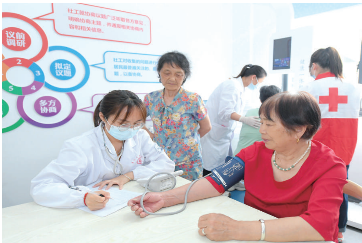
5月30日,埭溪镇中心卫生院的医务人员在为老年人进行健康问诊。近年来,浙江省湖州市吴兴区埭溪镇通过党建引领建机制整合社会资源,为辖区老年人提供基础性、个性化服务,让乡亲们在家门口就能享受到便捷的养老服务。

意见分六个部分共24条,明确人民法院开展家庭教育指导工作的范围和规定,规定人民法院在审理离婚案件过程中,对有未成年子女的父母双方,应当提供家庭教育指导。对于涉及抚养、收养、监护权、探望权纠纷等案件,以及涉留守未成年人、困境未成年人等特殊群体的案件,人民法院可以就监护和家庭教育情况主动开展调查、评估,必要时,依法提供家庭教育指导。