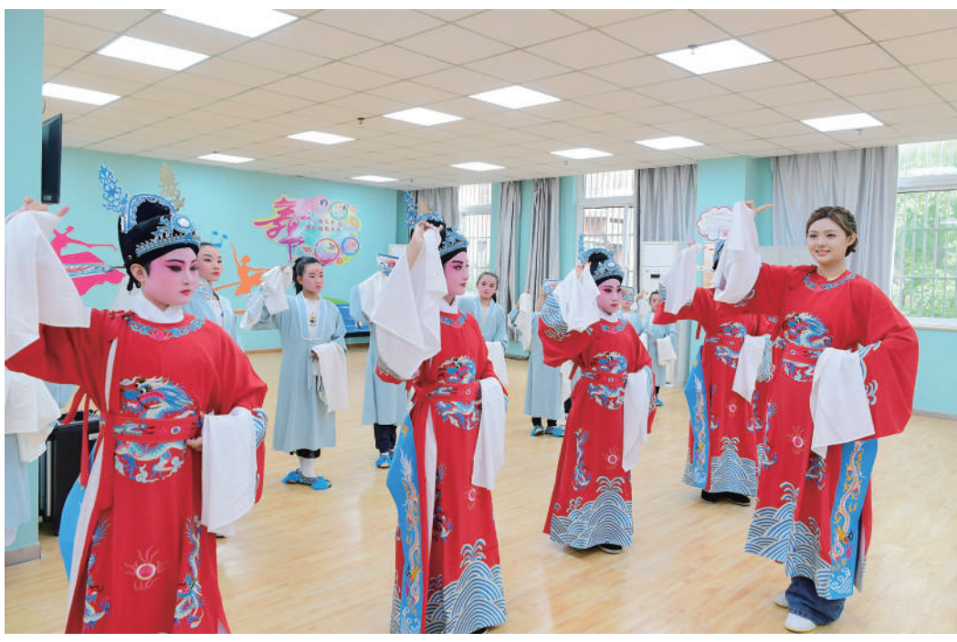
6月3日,在肥西县桃花镇柏堰社区新时代文明实践站,老师指导小朋友学习黄梅戏动作。

新华社洛杉矶电(记者 谭晶晶)中国科研团队日前发表研究论文说,他们研发出一种能够快速溶解肿瘤并抑制肿瘤细胞转移的广谱抗肿瘤药物。