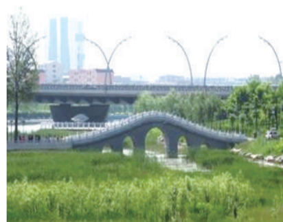
我喜欢泮汇公园，但我更喜欢公园的美景。 星辰双语三(1)班 刘博然(本报小记者)

啊，祖国！在70多年来，您取得了许多辉煌成就：先进的医疗技术，嫦娥五号探测器完成我国首次的外天体采样返回路场，北斗系统第五十五颗导航