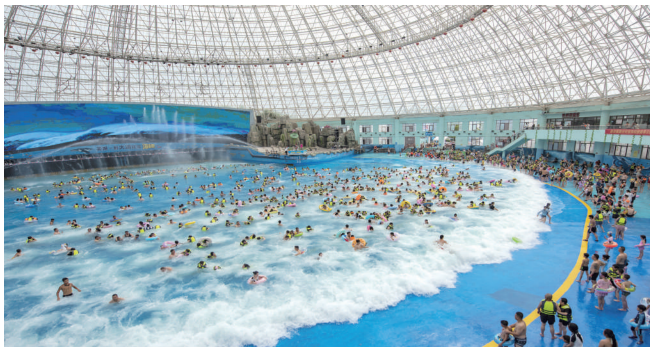
7月8日,游客在安徽省芜湖市南陵县大浦乡村世界的海啸馆戏水游玩。炎炎夏日,人们戏水游玩,乐享清凉。

7月9日清晨拍摄的河北省迁西县榆木岭长城景色。当日清晨,迁西县境内的长城附近晨雾缭绕,长城、山峰、村庄、晨雾等呈现出壮美的水墨画卷。