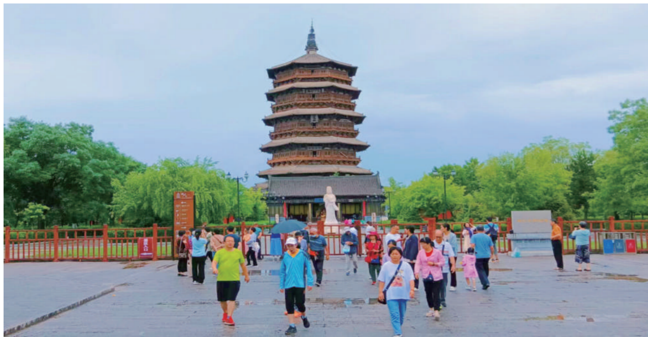
近日，应县木塔景区游人如织。随着“暑期档”开启，暑期游“升温”，前往应县木塔景区游览的游客络绎不绝。

高质量发展工作；三是两级院领导对专项活动中的重大疑难案件挂牌督办，先后成立了朔州市企业合规领导小组、知识产权领导小组等，精准办理涉及侵犯民营企业权益案件。推进大数据信息化平台建设，与检察办案融合，开展案件受理环节涉案企业识别和标记工作，以数据赋能全面提升服务保障工作质效。（下转第2版）