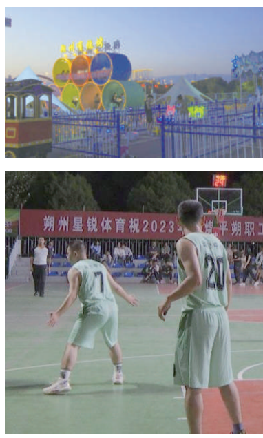
的特色“夜经济”活动。同时,形式多样的促消费活动,也让“夜经济”成为消费新动力。(张智宙 马富瑞)