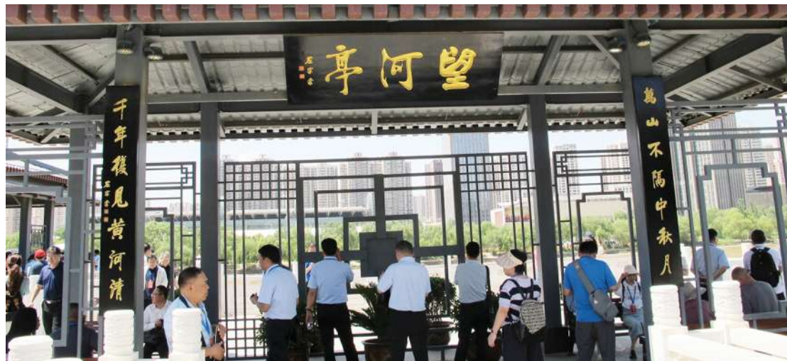
▲兰州望河亭是品鉴黄河风情线的殊胜之地。图为百家城市党媒记者慕名在此拍照打卡,驻足一睹黄河盛景。