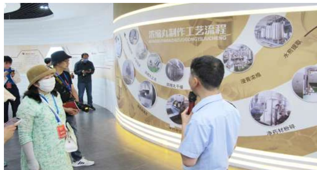
▲兰州佛慈制药股份有限公司是一家具有近百年制药历史的中华老字号企业,2018年“出城入园”搬迁至兰州新区。现有药品生产批准文号467个、独家产品10个。图为企业员工向百家城市党媒记者讲解药品制作工艺流程。