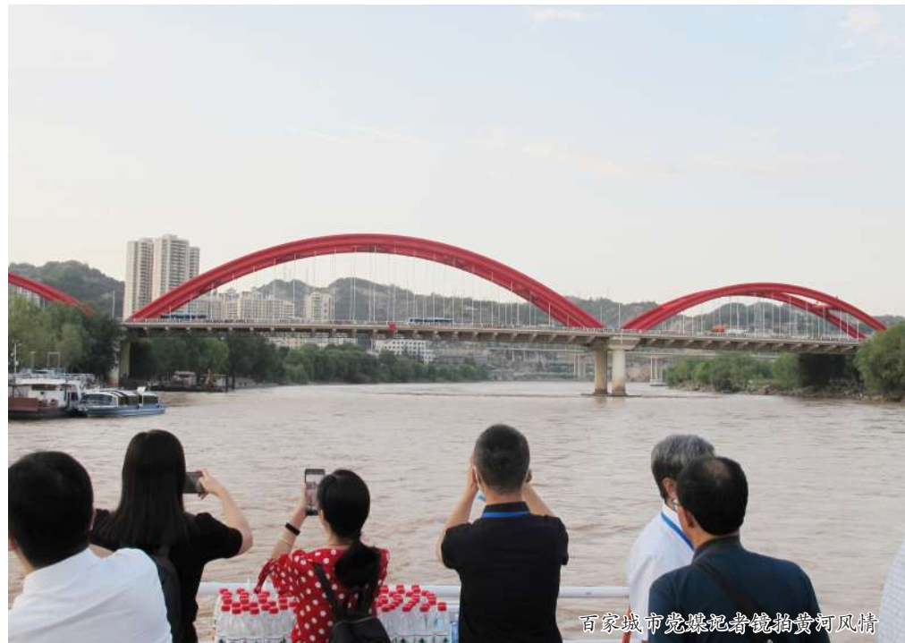
百家城市党媒记者镜头拍黄河风情

兰州历史悠久,底蕴深厚。自古就是“联络四域、襟带万里”的交通枢纽和军事要塞。如今已跻身于全国9大物流区域、10大物流通道和21个全国性物流节点城市领先行列,成为新亚欧大陆桥和我国面向中亚、西亚开放的战略通道。享有“丝路明珠”“黄河之都”之美誉。