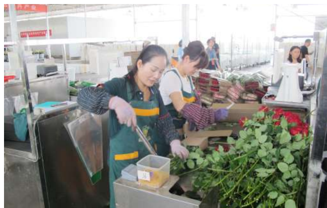
▲种植玫瑰目前已成为兰州新区乡村振兴的亮点产业。图为产业员工正在修剪打包即将走向市场的玫瑰花。