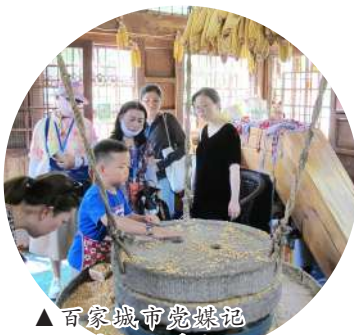
▲百家城市党媒记者在石磨坊观看小朋友示范操作水磨玉米。