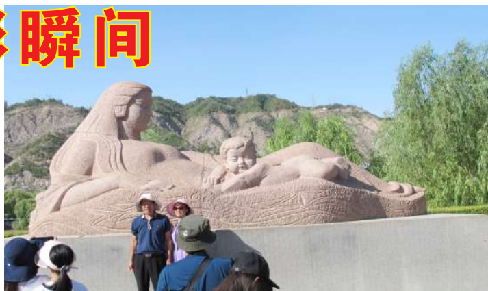
▲黄河母亲雕塑位于甘肃省兰州市黄河南岸的滨河路中段、小西湖公园北侧,是全国诸多表现中华民族的“母亲河”——黄河的雕塑艺术品中最漂亮的一尊,象征着黄河母亲爱护保护着中华民族。图为游人正在雕塑前拍照留影。