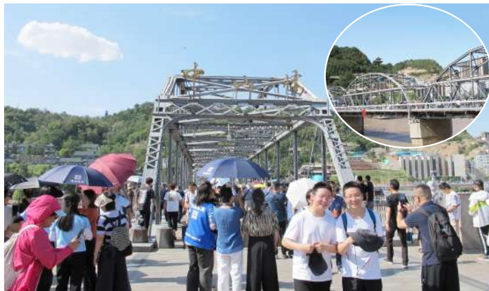
▲兰州黄河铁桥,又名中山桥,是中国近代史上兰州市、甘肃省乃至整个西北地区第一座引进外国技术建造的桥梁。这一特殊的建设背景及建设年代使兰州黄河铁桥变成了研究近代史的钥匙,在中国的建筑历史上占有独特的地位,并创造了近代运输史上的奇迹。