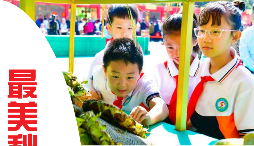
孩子们体会丰收的喜悦