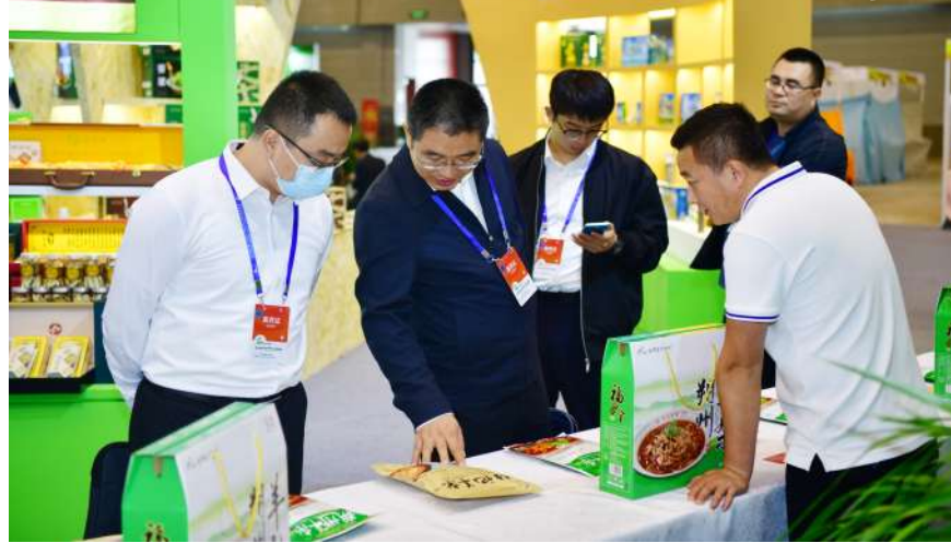
朔州展厅一角

又是一年秋分时,丰收画卷满三晋。9月26日,为期四天的第八届中国(山西)特色农产品交易博览会在太原市晋阳湖国际会展中心隆重开幕。借助这一平台和机遇,我市共有37家农业龙头