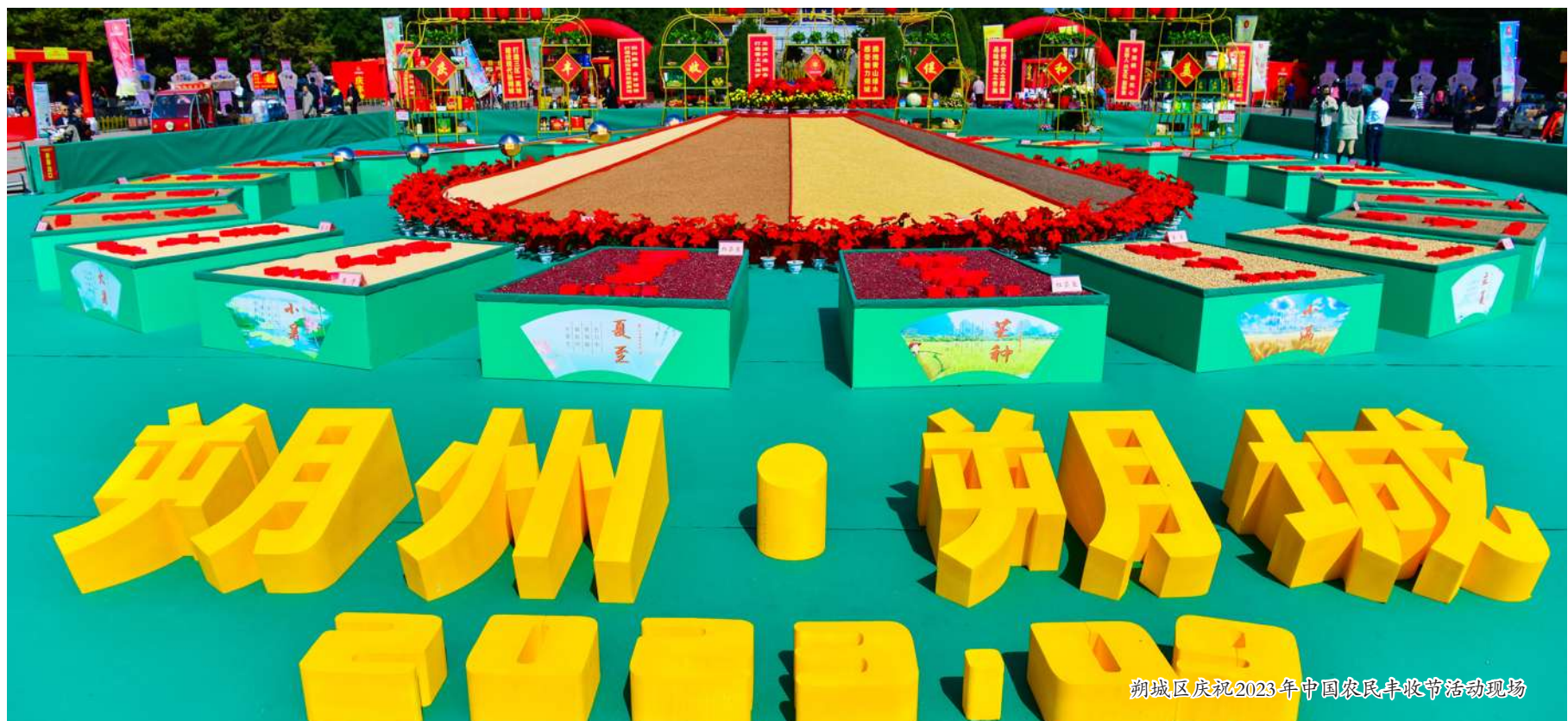
朔城区庆祝2023年中国农民丰收节活动现场