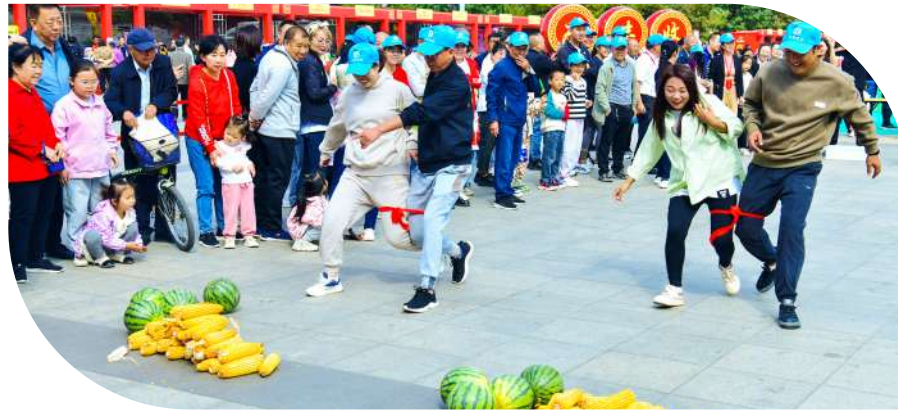
农民趣味竞赛现场