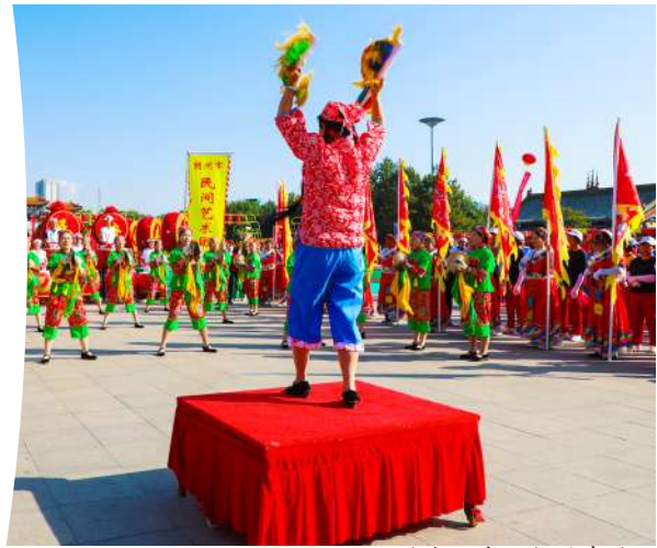
民间艺术团威风锣鼓表演