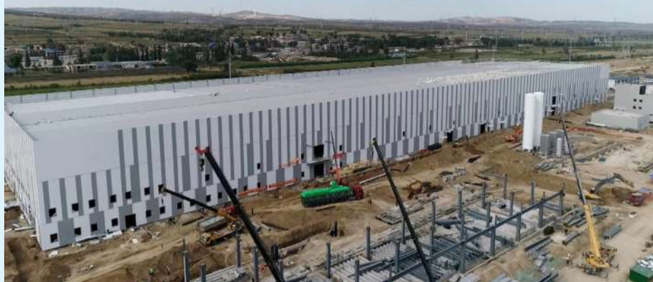
位于平鲁区经济技术开发区,投资12亿元的三一朔州一期5GW单晶硅项目,现已完成了80多台单晶炉的安装,于9月28日正式投产运行,这也是山西首个规模化光伏单晶硅项目。