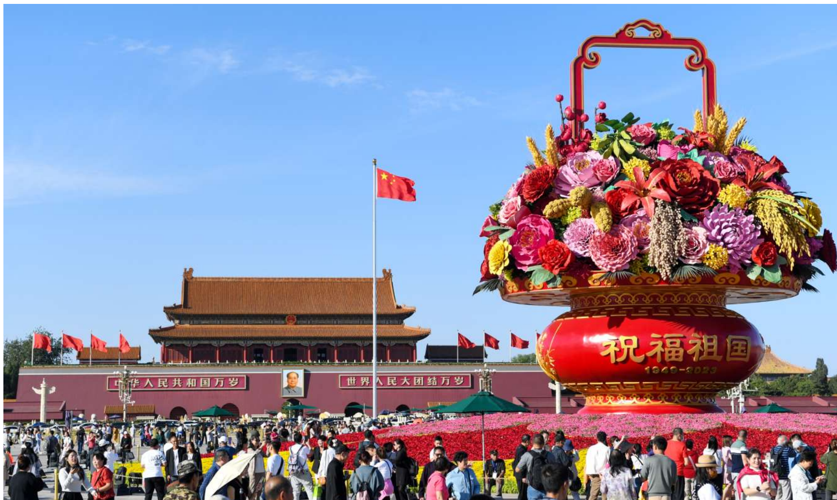
9月27日,市民游客在天安门广场参观“祝福祖国”巨型花篮。中秋及国庆节假期临近,北京天安门广场上的“祝福祖国”巨型花篮吸引着众多市民游客参观游览。