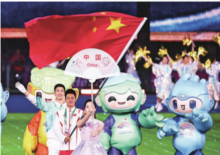
中国代表团旗手谢震业(左二)在闭幕式上入场。