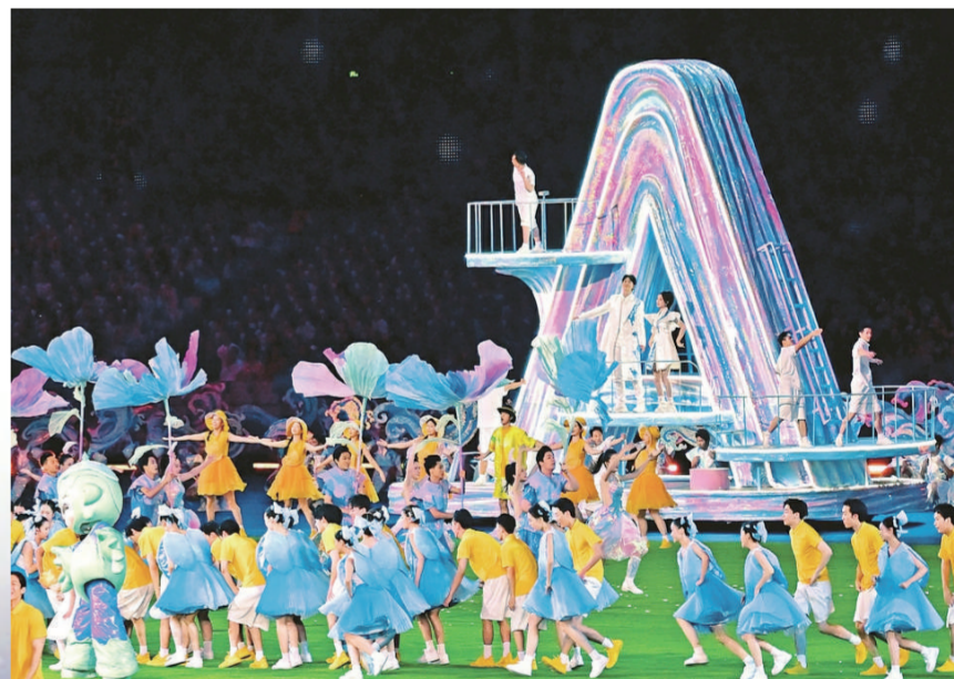
演员们踏歌起舞。

亚运聚欢潮，璀璨共此时。第十九届亚洲运动会8日晚在杭州圆满闭幕。钱塘江畔，夜幕下的杭州奥体中心体育场流光溢彩，宛如一朵美丽的“大莲花”。场内欢声笑语、歌舞飞扬。来自亚洲各国各地区的运动员相聚于此，分享属于他们的体育文化盛宴。 20时整，以“最忆是杭州”为主题的闭幕式开始。全体起立，高唱中华人民共和国国歌，鲜艳的五星红旗冉冉升起。 大屏幕上播放的开场短片《亚运聚欢潮》开启了欢歌之夜。节目《璀璨共此时》营造出“Asia”标识从江面涌出，立于钱塘江上空，连同潮水“自天而来”、落入现场的视效。数控草坪上，19朵巨型桂花、周围的璀璨之花、“Asia”字样车台构成蓬勃