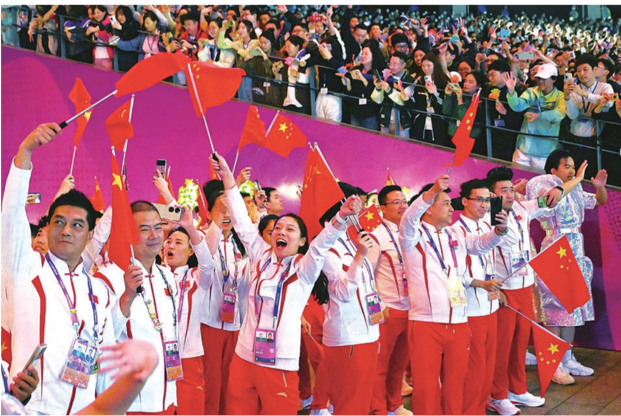
中国体育代表团在闭幕式上。