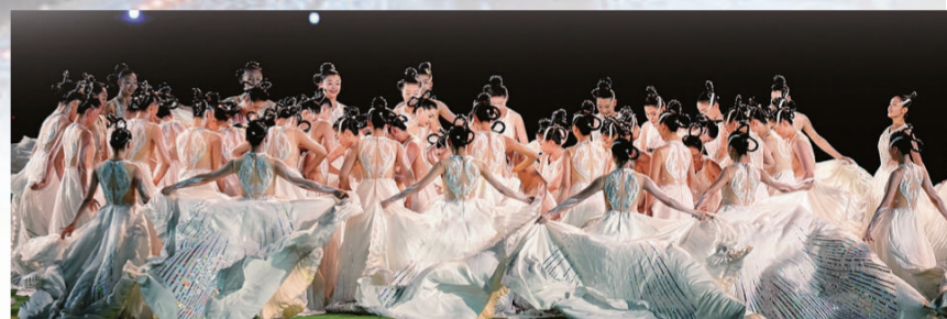
闭幕式上的精彩表演。