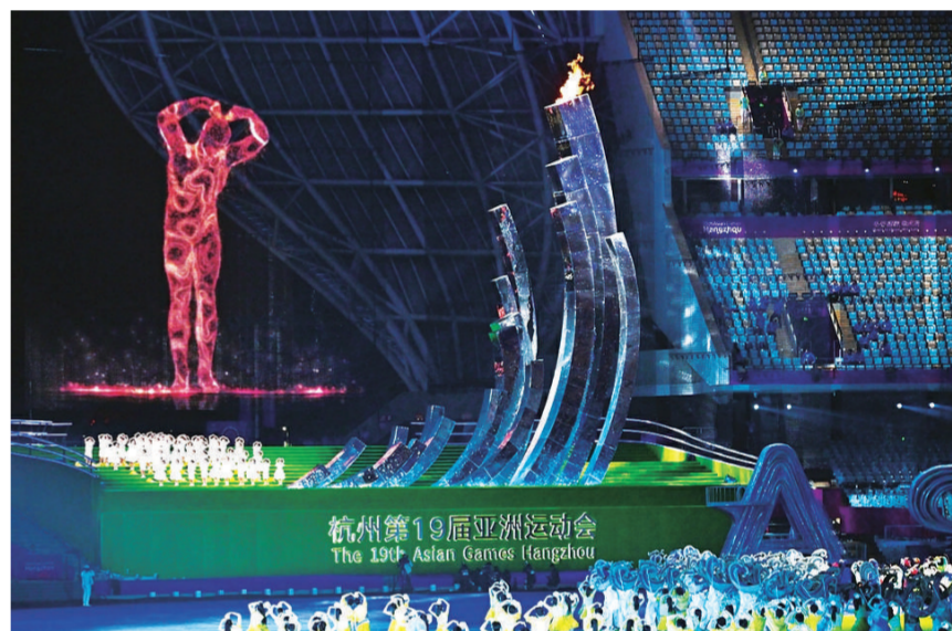
数字火炬手“弄潮儿”在主火炬熄灭仪式上。