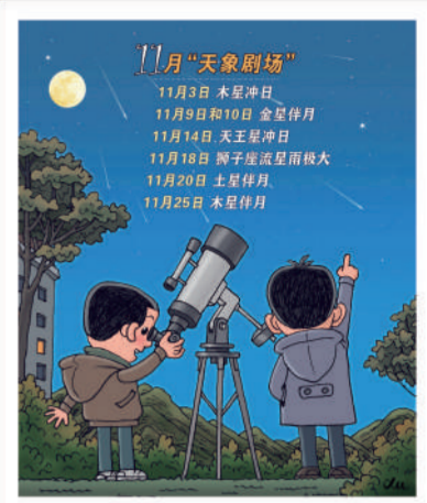
轮番上演现夜空 徐骏 作

新华社天津电(记者 周润健)11月“天象剧场”上新,木星冲日、金星伴月、天王星冲日、狮子座流星雨极大、土星伴月、木星伴月等天象将轮番上演。11月3日,木星冲日率先登场。木星冲日是指木星和太阳正好分处地球两侧,三者几乎成一条直线,当天木星被太阳照亮的一面会完全朝向地球。