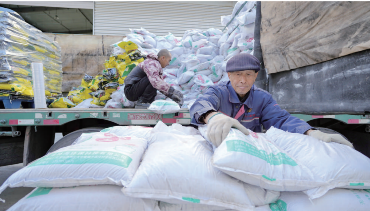
11月16日，在位于唐山市丰润区的唐山公路港物流有限公司，工人在整理农资产品。近年来，河北省唐山市丰润区依托当地交通优势和产业基础，不断加大物流园区建设力度，发展以商贸物流、电子商务以及生产性服务业等业态为主的现代服务业，全力打造北方区域性物流枢纽。

在放宽外资准入方面，李超说，我们将会同有关部门推动合理缩减外商投资准入负面清单，全面取消制造业领域外资准入限制措施。