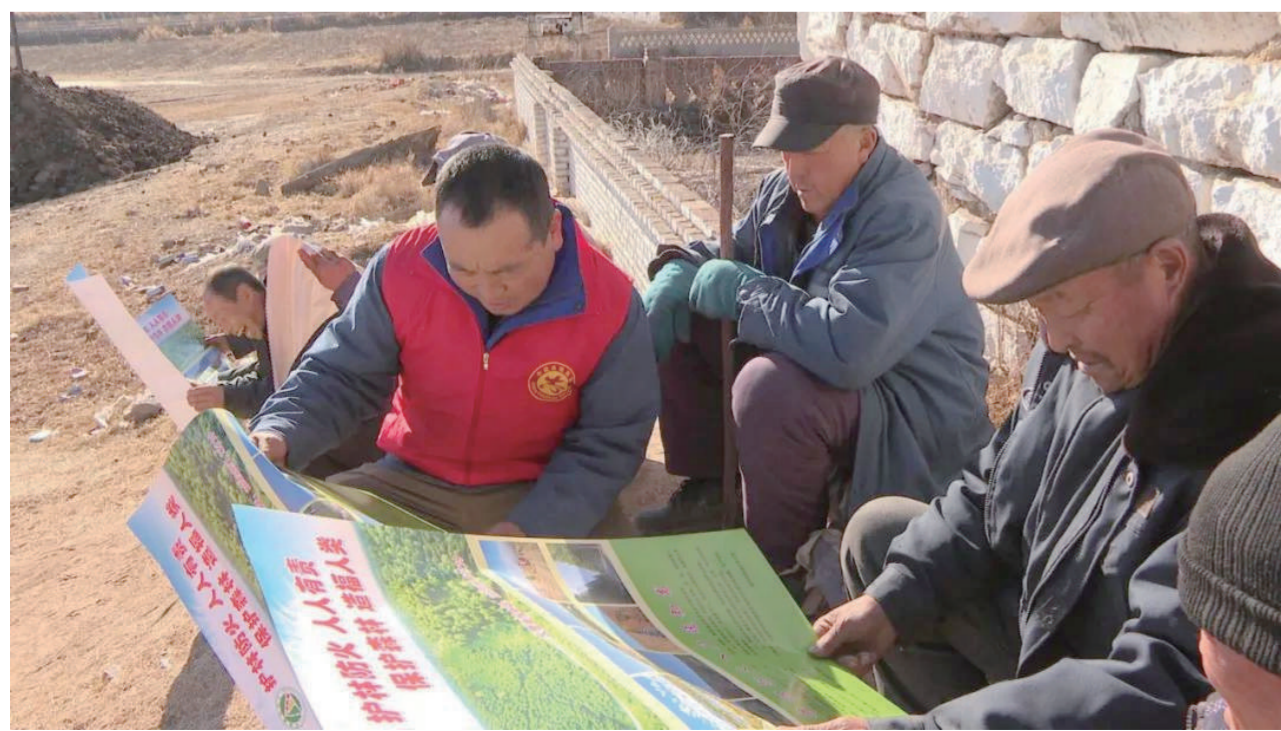
当前,进入冬季森林草原防火关键期,为做好护林防火工作,朔州各区县深入下沉一线,网格化管理巡查,打通护林防火的“最后一公里”,全力保障森林资源安全。该镇通过入户宣传、发放资料、流动宣传车、固定标语等多种形式,及时把防火知识、法律法规传递到千家万户,构筑起一道全民防火墙。

以创新为驱动、以项目为载体,我市聚焦产业创新转型升级,扎实开展质量效益提升、技术改造升级、科技创新等工作,全力推动先进装备产业实现高质量发展。全市现有规模以上机械及装备制造企业38户,建有省级企业技术中心2户、市级企业技术中心9户。经过多年发展,产品涵盖煤机装备、智能装备、新能源车等多个领域,