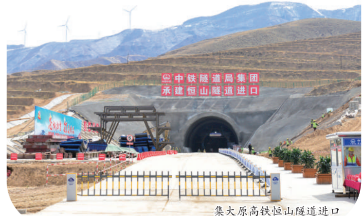
集大原高铁恒山隧道进口