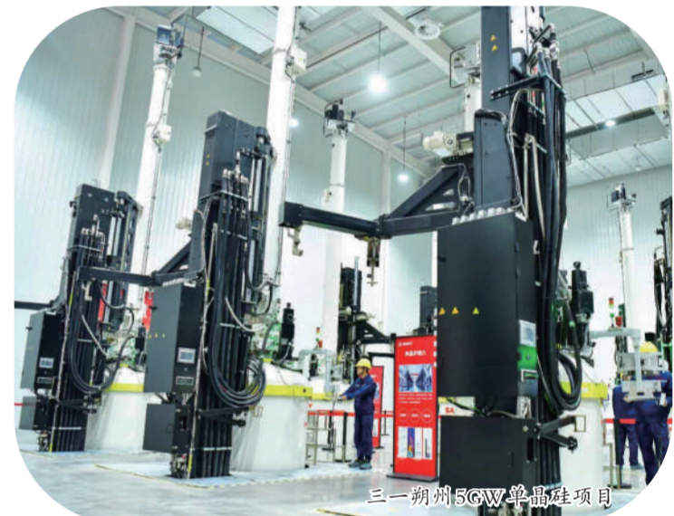
三一朔州5GW单晶硅项目