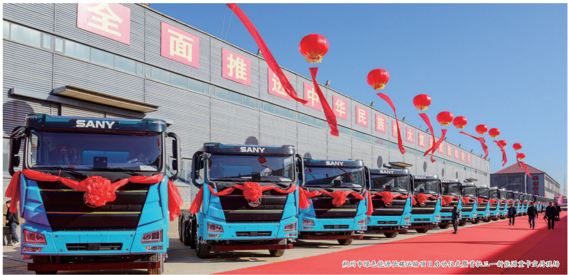
朔州市绿色能源低碳运输项目启动仪式暨首批三一新能源重卡交付现场