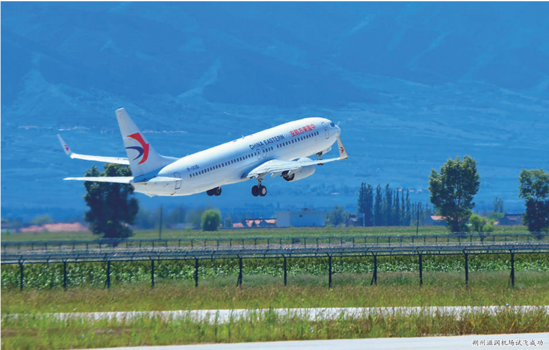
朔州滋润机场试飞成功