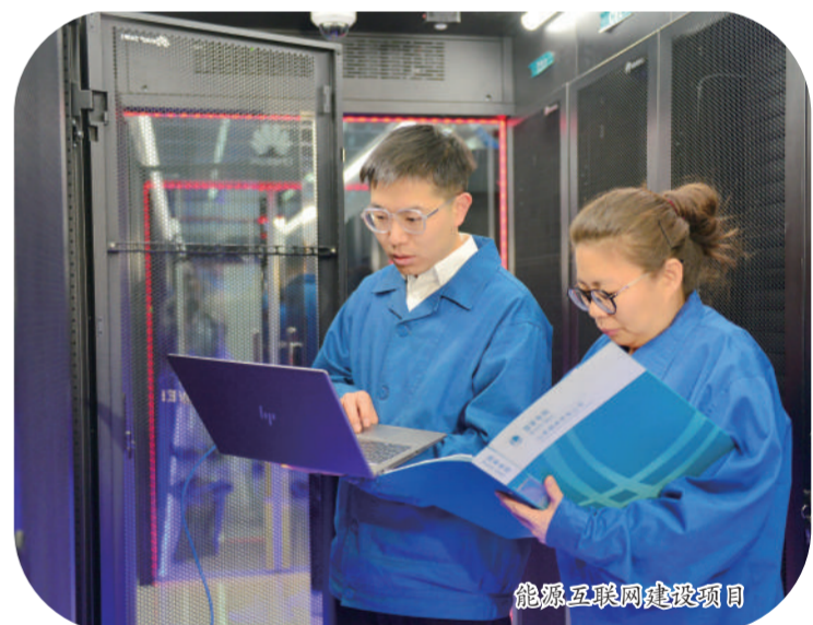
能源互联网建设项目