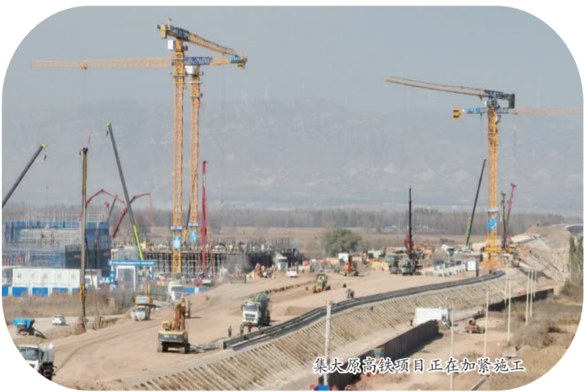
集大原高铁项目正在加紧施工