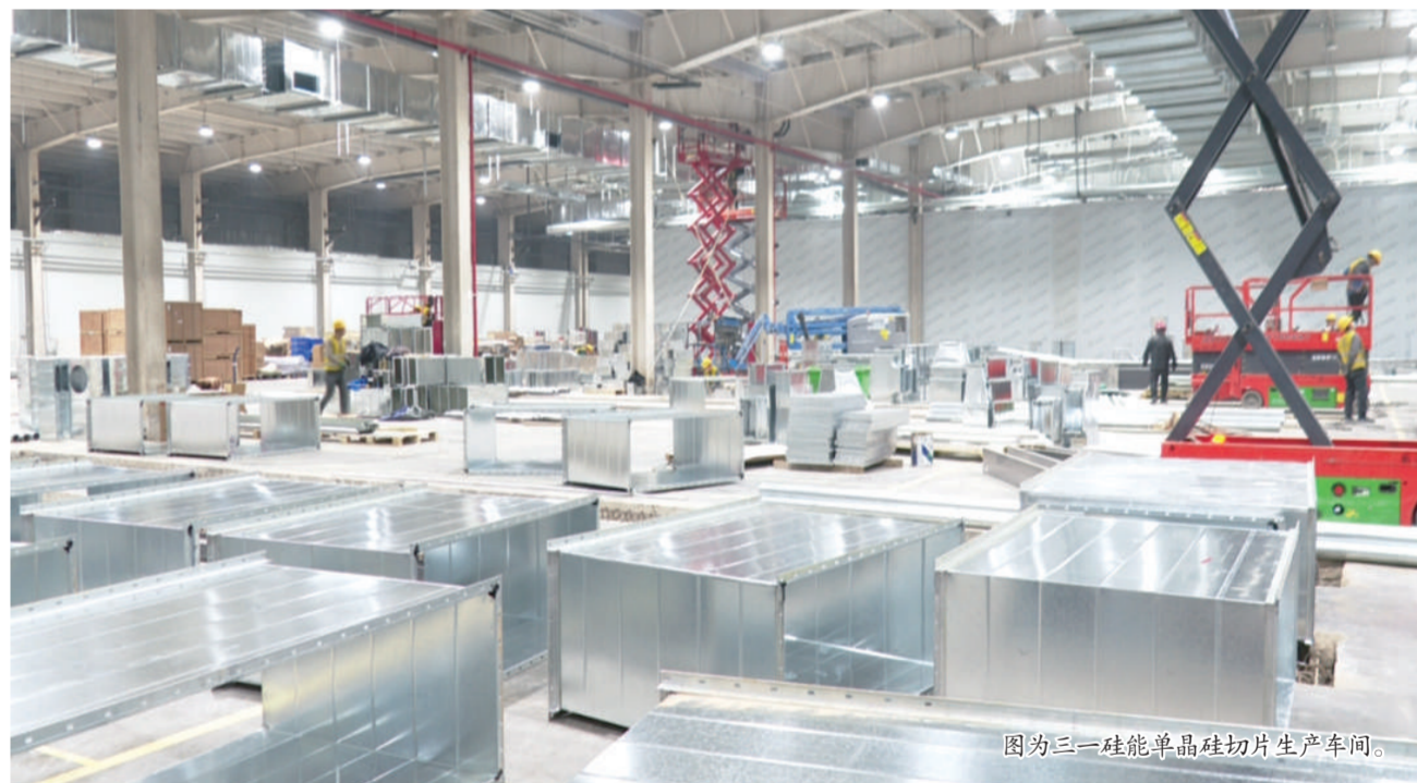
图为三一硅能单晶硅切片生产车间。

本报讯(记者 罗文平 张小菊 韩嘉明 陈萍) 岁寒天冷,迎着塞北的冬日暖阳,沿着光伏制造的产业链条,记者走进三一朔州二期超薄单晶硅片项目,探寻“追光者”的脚步。凛冽的寒风挡不住建设者们前进的步伐,三一朔州二期超薄单晶硅片项目施工现场依旧热度不减,在设备安装的关键阶段,园区管理人员和一线工人坚守岗位,克服冬季施工带来的不利影响,顺利完成了首条生产线的安装工作。