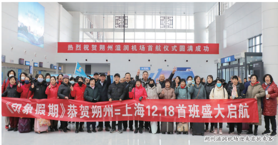
朔州滋润机场迎来首批乘客