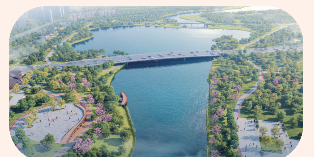
狭河七期治理效果图