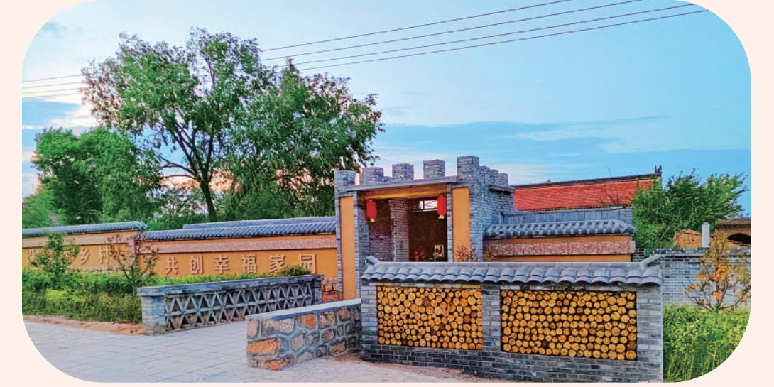
美丽乡村 幸福家园