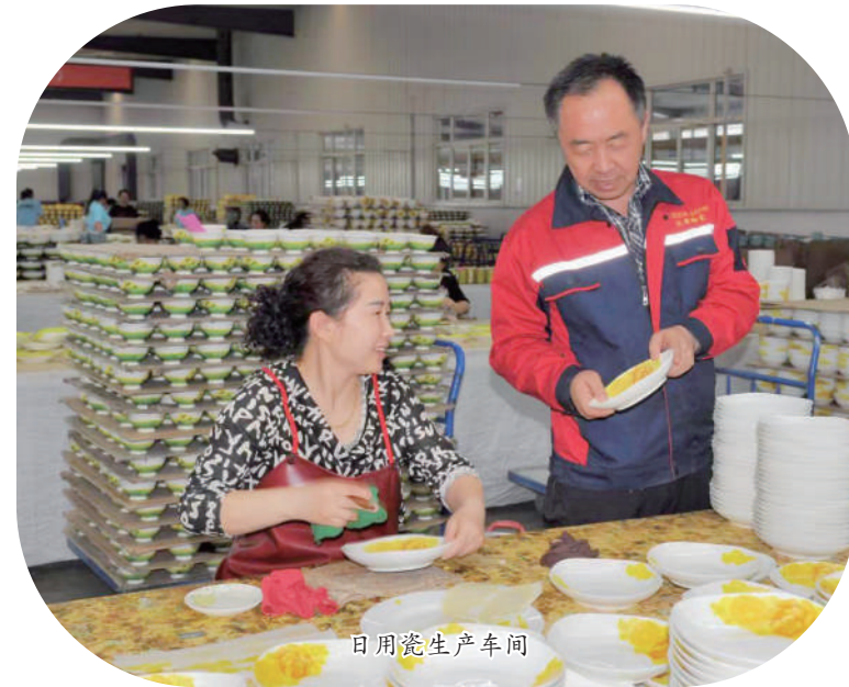
日间窝生生产车间