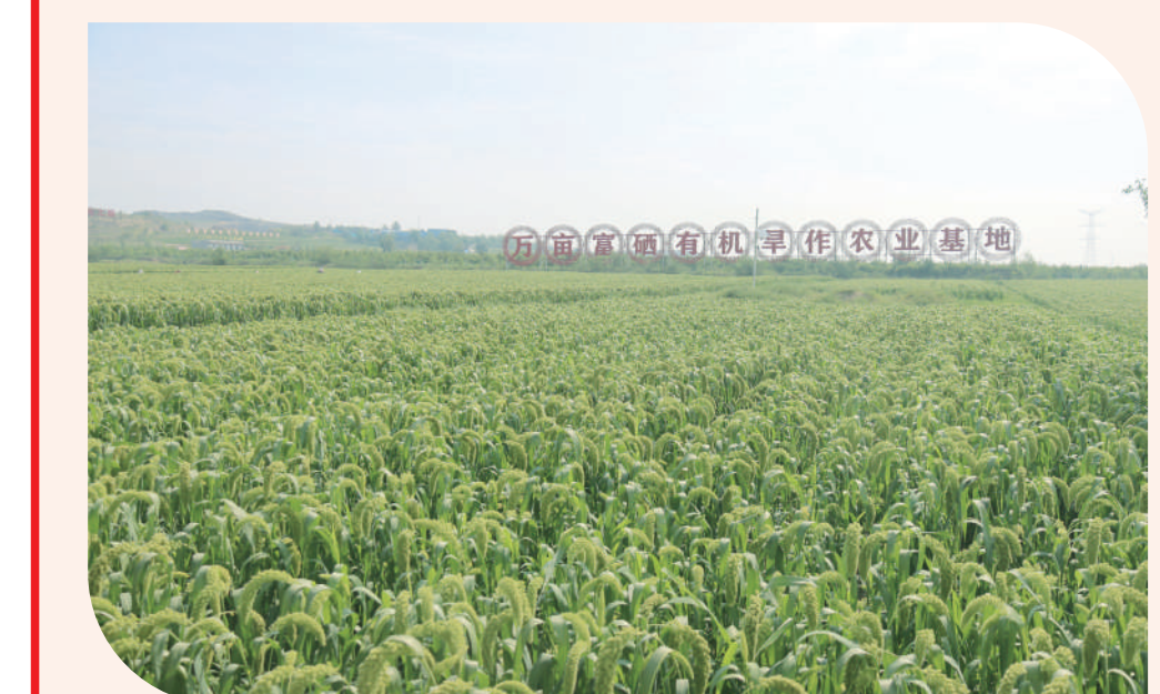
万亩富硒有机旱作农业基地

园投入使用，城市框架进一步拉大，空间外延持续拓展，城市功能日趋完善。 教育质量显著提升。持续巩固“双减”成果，深入开展校园安全防範三年行动，扎实推进教学质量提升、优秀校长选树、名优教师培育、师德师风建设、优质生源巩固、数字化校园建设“六大工程”，办学条件显著改善，高考成绩稳中有升。 健康山阴稳步推进。深化县域医疗卫生一体化改革，农村卫生室全部达到一医一药或者一医多药。基层中医馆建设实现全覆盖，合格率100%。通过全国基层中医药工作示范县初评验收。成功举办山西省第十六届运动会羽毛球比赛、山西省跆拳道俱乐部联赛（北部赛区）和夏季台球精英赛等赛事，全民健身运动蔚然成风。 社会事业全面进步。深入实施“人人持证、技能社会”全民技能提升工程，扎实做好重点群体就业、城镇新增就业3719人，劳务输出560人，荣获全省就业创业先进集体荣誉。乡镇就业服务站实现全覆盖，建成县零工市场并投入运行，服务零工1000余人。积极推进全民参保，持续扩大社会养老保险覆盖面。严格落实医保分类资助、低保、五保、孤儿、重度残疾人等特殊人群参保资助资金全部划转到位。积极推行“一站式”服务“业务下沉”等便民措施，县域内定点医疗机构全面实现“一站式结算”。 生态底色更加厚重。以创建生态文明示范区为契机，统筹推进山水林田湖草沙系统治理，全年完成植树造林3.3万亩，出境断面水质、地下水源全部达标。扎实开展秋冬季污染防治综合治，全年二级以上天数313天，全省排名第12，改善幅度排名朔州市第一。 奋楫扬帆启新程，凝心聚力谱新篇。下一步，山阴县将更加紧密团结在以习近平总书记为核心的党中央周围，全面贯彻落实党的二十大精神，在省委省政府、市委市政府的坚强领导下，踔厉奋发，勇毅前行，着力高质量发展，深化全方位转型，奋力谱写中国式现代化山阴新篇章。 文：闫文婧