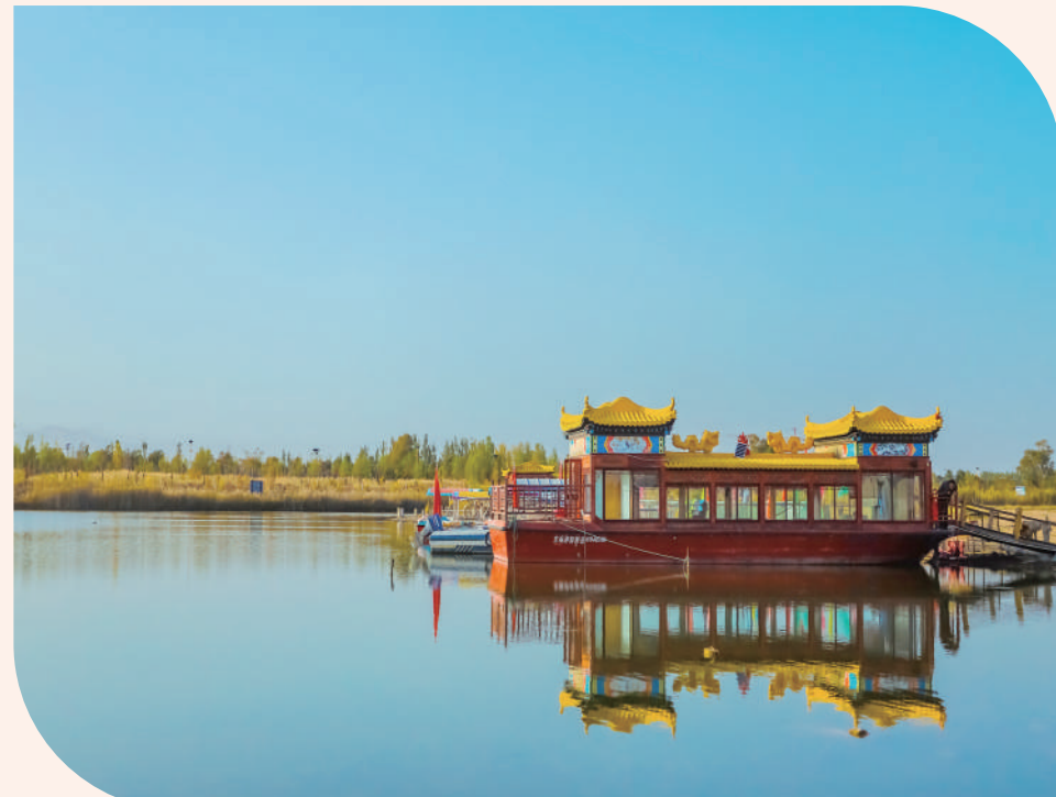
山阴县桑干河国家湿地公园