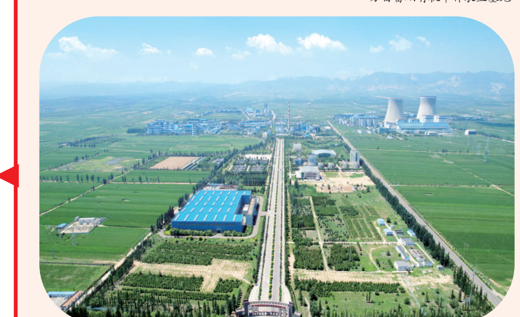
山阴经济技术开发区