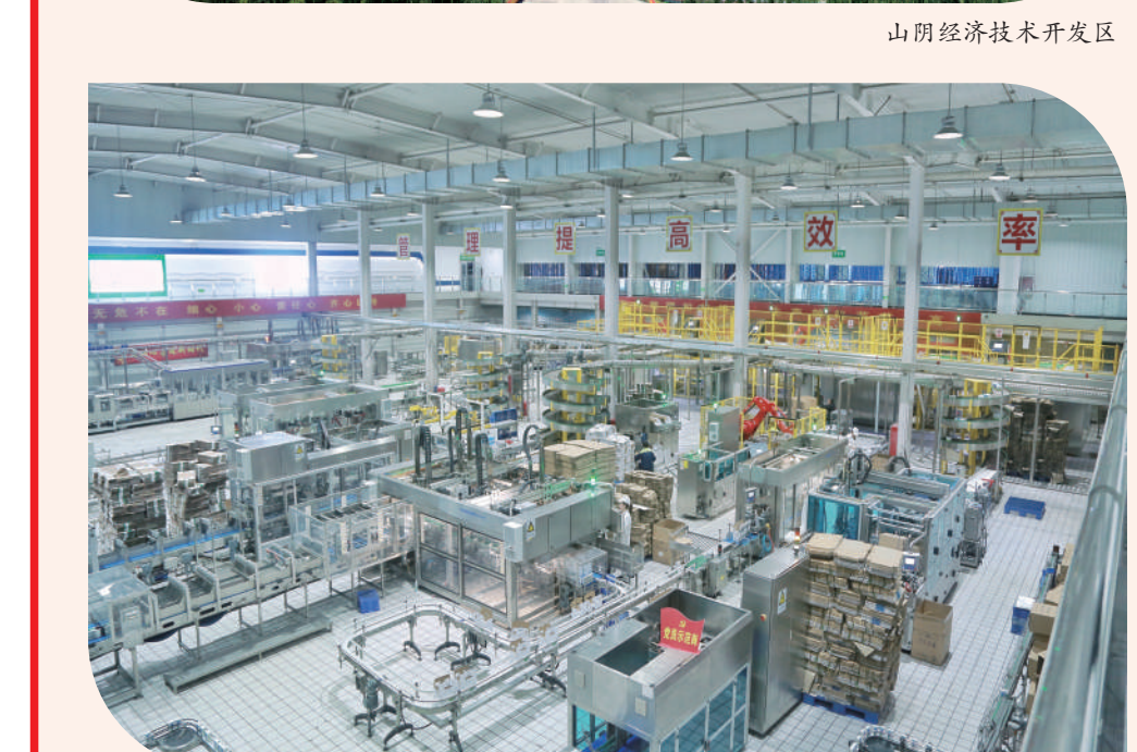
山西古城乳业15万吨液态奶生产线外包装车间