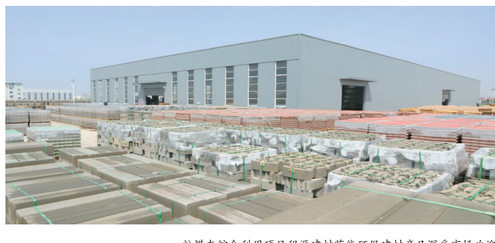
粉煤灰综合利用项目程源建材节能环保建材产品深受市场欢迎