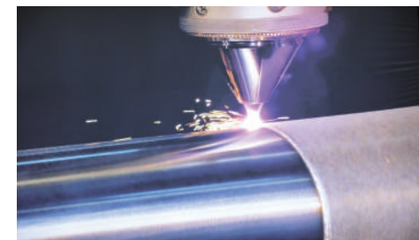
园区重点企业金华实业激光覆技术