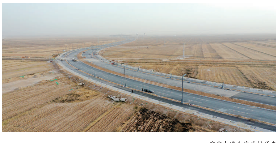
迎宾大道全线半幅通车