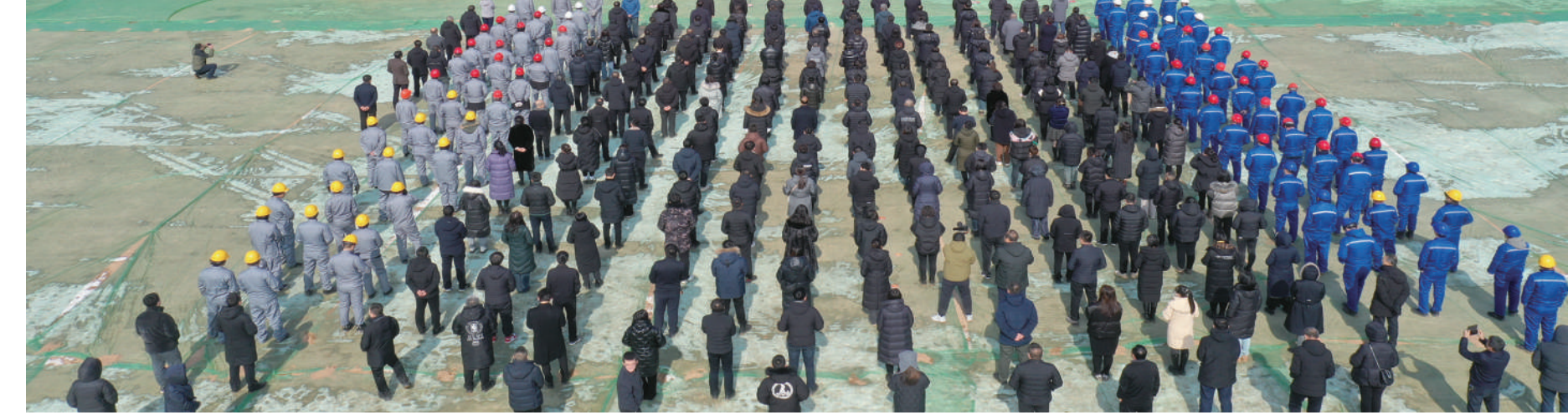
2024年第一次“三个一批”活动朔州分会场