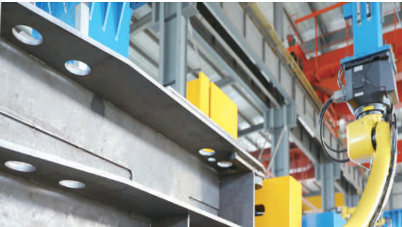
园区重点企业繁盛昇新上的智能修复设备

改革新区、倾听发展澎湃潮声；开放高地、演绎波澜壮阔新篇。惟其艰难，方显勇毅，作为全市经济发展的主阵地、主引擎和主战场，2023年，朔州经济开发区上下“一盘棋”、拧成“一股绳”、共绘“一张图”，全力以赴拼经济、千方百计稳增长、力争分秒秒发展，交出了一份亮眼答卷——2023年地区生产总值突破133.6亿元，增速16.6%，排名全市第一。财政总收入突破105亿元，增速4.8%，一般公共预算收入完成8.15亿元，规上工业增加值完成45.98亿元，增速40%，全市第一。工业投资完成18.5亿元，增速21.2%。转型项目投资完成16.98亿元，占比91.8%，“四上”企业完成178家，增速17.9%。高新技术企业完成30家，增速36.4%。产出强度完成342万元/亩。省考6项指标全部超额完成省定目标。