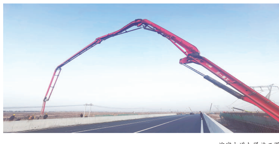
迎宾大道加宽施工现场