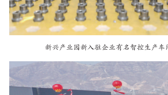
新兴产业园入驻企业有名智控生产车间