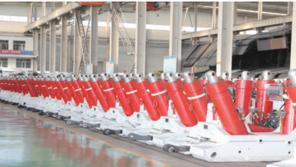
园区重点企业中煤四达