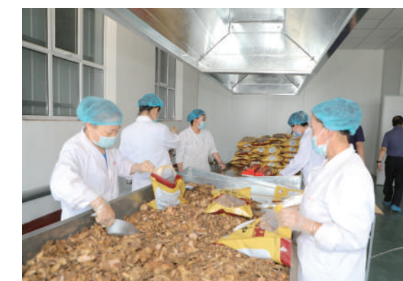
园区重点企业山西欣晋元中药材车间