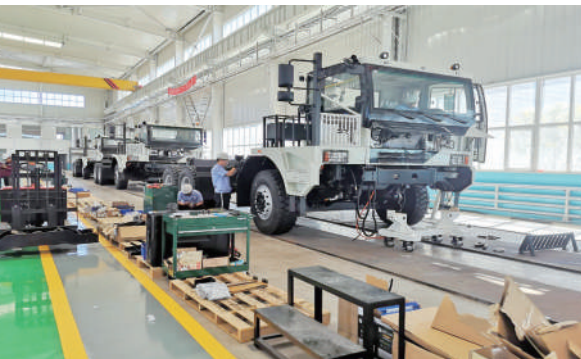
诺浩机电公司矿用新能源运车生产车间工人在工作中