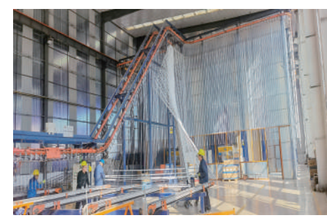
园区重点企业于瑞电冰车间