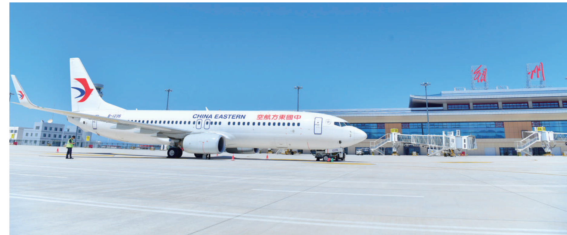
位于临港物流园的朔州机场