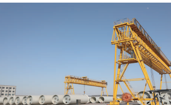
园区重点企业晋能风电