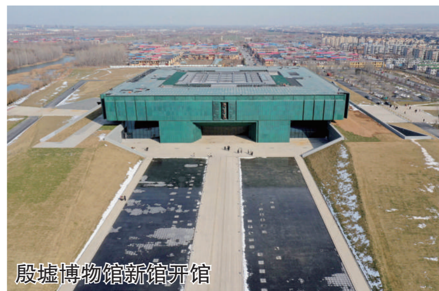
殷墟博物馆新馆开馆

据了解,此处六朝遗迹十分丰富,发现越城垒、御道和国门、水井、窑、灰坑、墓葬等500余处,出土遗物包括瓷器、砖瓦构件等万余件。