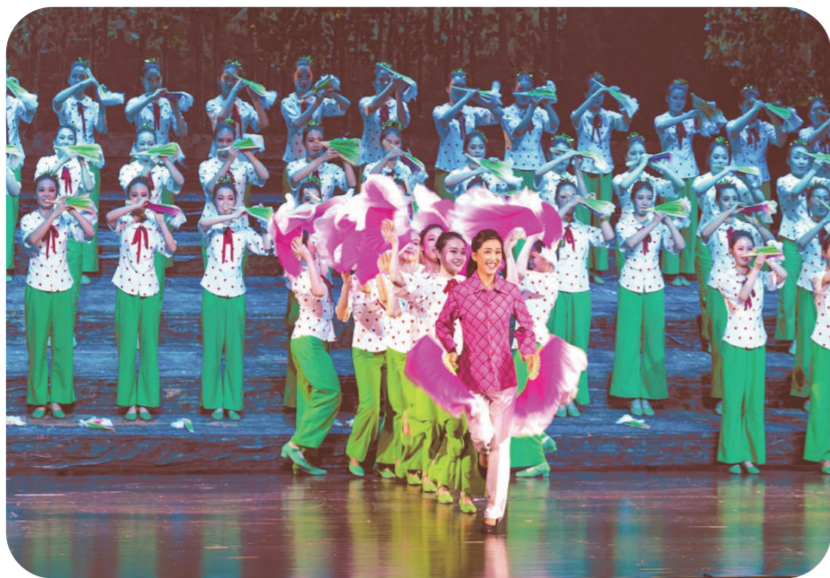
民族歌剧《小老杨》剧照

是根据剧中人物和演员自身特点,将民族、美声、通俗等多种唱法融入其中,使人物个性展现得更加鲜活生动。