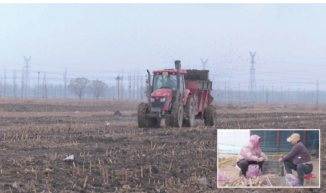
朔城区贾庄乡立足当地资源禀赋,围绕“特”字进行谋篇布局,不仅将特色产业作为有力抓手,大力培育种植山药等特色高效经济作物,而且通过土地流转、基地打工让村民在家门口就能实现致富增收。图为在朔城区贾庄乡贾庄村的千亩山药种植基地,各类大型机械正在进行旋地和撒肥料,农户为种植工作作准备。

本报讯3月29日,山阴县邀请专业人员为近40名环卫工人普及道路交通安全知识。 宣讲人员详细讲解了环卫工人在日常作业中存在的交通安全隐患,提醒大家坚决杜绝闯红灯、逆向行驶、随意横穿马路等不文明的交通行为,在恶劣天气下要加大安全保护措施,并现场演示了头盔的正确佩戴方式。 此次活动进一步提升了环卫工人的道路交通安全意识,对共同营造安全、畅通、有序的道路交通环境起到了积极的推动作用。 (董建帅 赵琪 樊治霞)