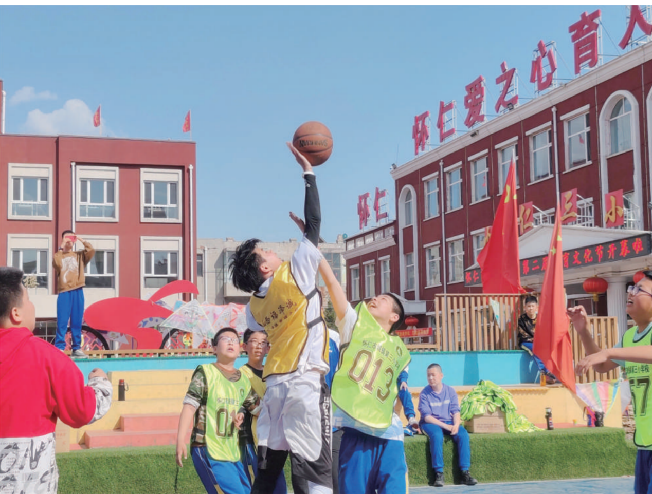
为进一步落实国家“双减”政策，大力推行素质教育，展现新时代中小学生的形象，促进校园文化建设，怀仁市城镇第三小学举办第二届体育文化节，主题为“逐体育强国梦，展运动之风采”，包括拔河、跳绳、短跑、篮球、足球、纸飞机等8大项16个小项比赛项目。

义诊现场，人头攒动。来自市传染病医院的医务工作者为每一位前来咨询、问诊的居民测血压、测血糖，进行B超、心电图等检测，并耐心讲解如何预防常见病知识以及检查时间和注意事项等。同时，医务工作者们认真倾听居民的心声，并根据具体情况指导居民合理膳食，养成健康科学的生活习惯。红十字志愿者们还为前来义诊的居民们发放了红十字宣传视频，发放了宣传资料和爱心礼包，科普了造血干细胞捐献、人体器官捐献、急救救护等相关知识及重要意义。活动期间，红十字志愿者还在神头镇红十字博爱培训室，为社区居民送上一堂生动的安全教育实践课，让居民们进一步了解红十字文化，提升自身的安全防范意识与急救救护知识技能。