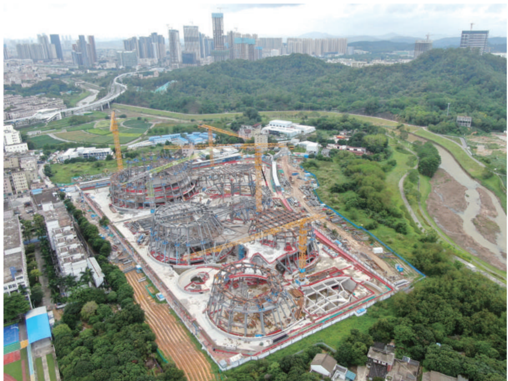
这是建设中的深圳自然博物馆项目。目前，位于深圳市坪山区的深圳自然博物馆项目正处于主体结构施工阶段，计划于6月中旬主体结构封顶。 深圳自然博物馆由中建五局承建，总建筑面积10.53万平方米，集收藏、展览、研究和自然科普教育于一体，是深圳市“新时代十大文化设施”之一。

新华社北京电(记者 赵文君) 记者4月30日从市场监管总局获悉，截至目前，我国已发布7项个体防护装备配备规范强制性国家标准。 个体防护装备，又称劳动防护用品，是保护劳动者在生产生活过程中的人身安全与健康所必备的一种防护用品，对保护劳动者在生产作业过程中免遭或减轻事故等外来伤害发挥着重要作用。 这些标准的发布实施有利于科学指导企业充分辨识、评估作业场所危害因素，有效指导各类生产经营单位为劳动者依法配备个体防护装备，也为监管部门开展安全生产执法检查提供了技术依据。 近年来，市场监管总局(国家标准委)联合应急管理部开展个体防护装备标准化提升三年专项行动，标准聚焦石油、化工、天然气、冶金、有色(金属)、非煤矿山、建材、电力、电子等高危重点行业安全生产工作需求，分行业列出易燃易爆作业、吸入性粉尘作业、有限空间作业、高处作业、带电作业等常见场景以及不同行业、不同工种可能存在的危害因素。同时，还规定了不同工种配备的个体防护装备的建议最长更换期限，以便保障各重点行业从业人员健康安全。