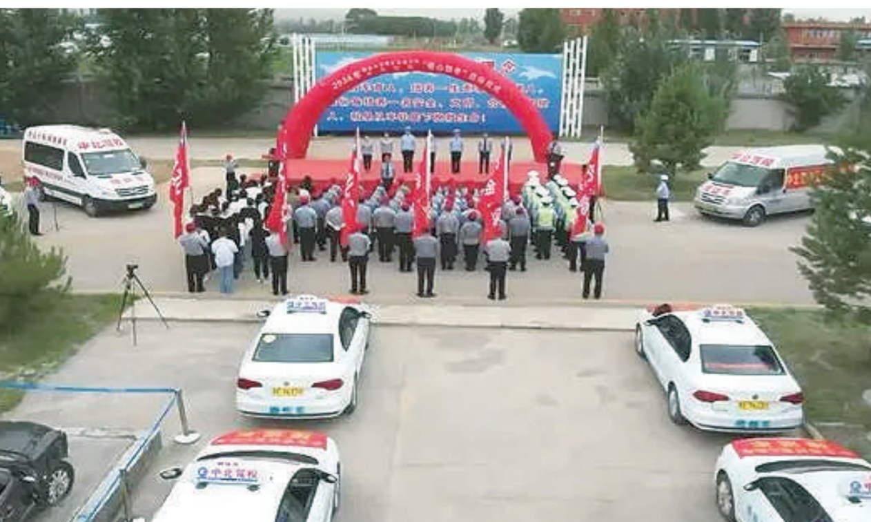
一年一度高考季,爱心如潮暖全城。近日,朔州市交警支队四大队联合中北驾校开展“爱心助考”启动仪式,全力保障莘莘学子顺利参加考试。张天宇 赵媛 聂慧丽 摄

16-32℃。总体来说,高考期间(6月7日-8日),7日气温总体适宜,有阵雨或雷阵雨,气象专家提醒考生提前安排路途行程,并携带好雨具;8日有高温天气,请考生做好防暑降温工作。另外雷雨天气多发,且局地性、突发性较强,提醒广大考生和家长及时关注最新的天气预报和预警信息,提前做好防御措施,注意调整好作息和饮食,适当调整着装,避免着凉感冒。