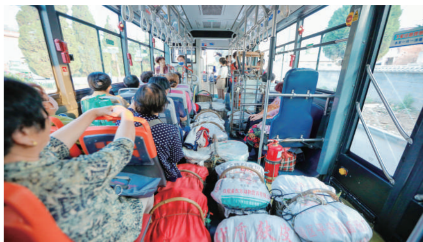
6月11日,在济南市南部山区柳埠街道,果农乘坐爱心果农专线车。近日,山东省济南市南部山区的樱桃、杏、油桃等应季水果陆续成熟上市。为方便果农出行,济南公交开通了多条爱心果农专线车,方便山区果农赶集售卖果品。