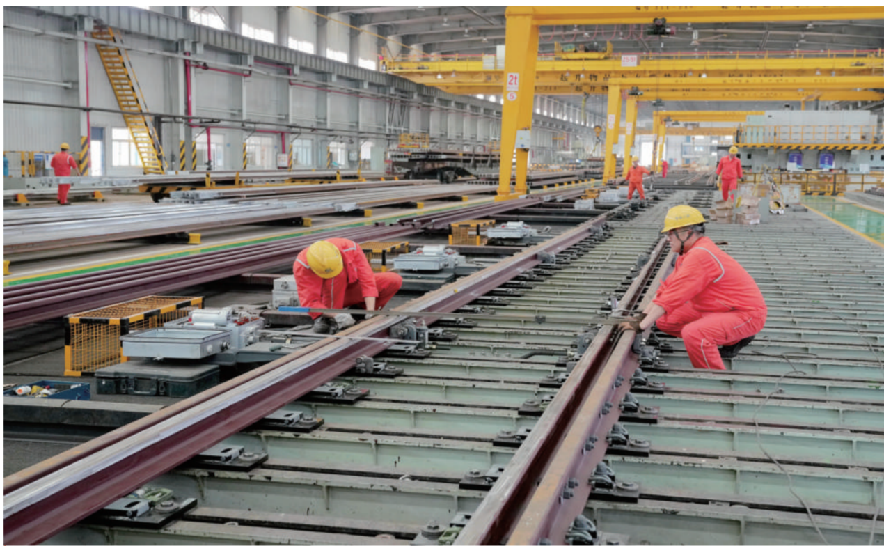
6月11日,河北省秦皇岛市山海关区中铁山桥集团有限公司的工人在道岔生产车间工作。近日,随着国内一些重要铁路及地铁项目有序推进,承接铁路道岔生产任务的河北省秦皇岛市山海关区中铁山桥集团有限公司生产车间内一派繁忙,工人们正保质保量加紧生产,助力中国铁路交通建设。中铁山桥始创于1894年,生产的道岔产品远销30多个国家和地区。

14114060001306,现声明作废。张富(身份证号140603196509122810),不慎将山西省朔州市平鲁区高石庄乡周家庄村《农村土地承包权证》丢失,权证编号:140603205207000066,现声明作废。张敏不慎将大同市金东南房地产开发有限公司出具的朔州市西山庭院小区13号楼2单元101号房的贷款保证金额明细单丢失,贷款金额:贰拾伍万元整(200000元),现声明作废。