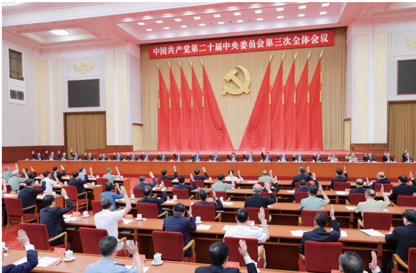
中国共产党第二十届中央委员会第三次全体会议,于2024年7月15日至18日在北京举行。中央政治局主持会议。