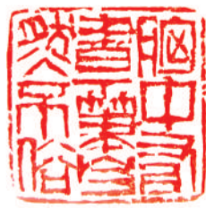
胸中有书下笔自然不俗