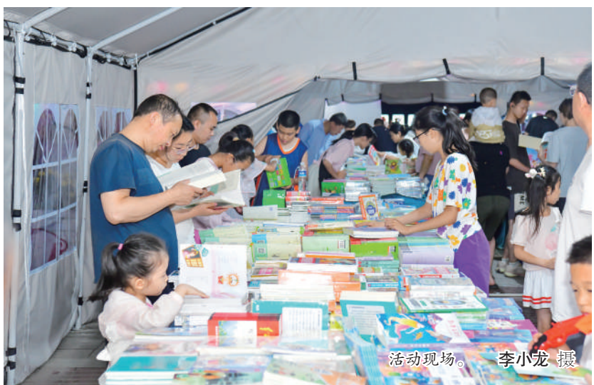
活动现场。