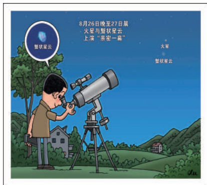
上演“亲密一幕” 新华社发 徐敬 作

新华社天津电(记者 周润健)天文科普专家介绍,8月26日晚至27日凌晨,火星将运行至蟹状星云附近,届时如果天气晴好,我国感兴趣的公众可于27日凌晨尝试欣赏这两个不同天体上演的“亲密一幕”。