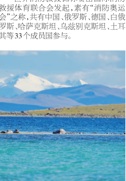
错鄂湖一景。位于西藏那曲市申扎县的错鄂湖,藏语意为“蓝色的湖”,湖面及周边湿地鸟类众多,景色宜人。

新华社哈尔滨电(记者 张涛)记者8月26日从第19届男子和第10届女子世界消防救援锦标赛新闻发布会上获悉,第19届男子和第10届女子世界消防救援锦标赛,将于9月5日至11日在黑龙江省哈尔滨市举行。