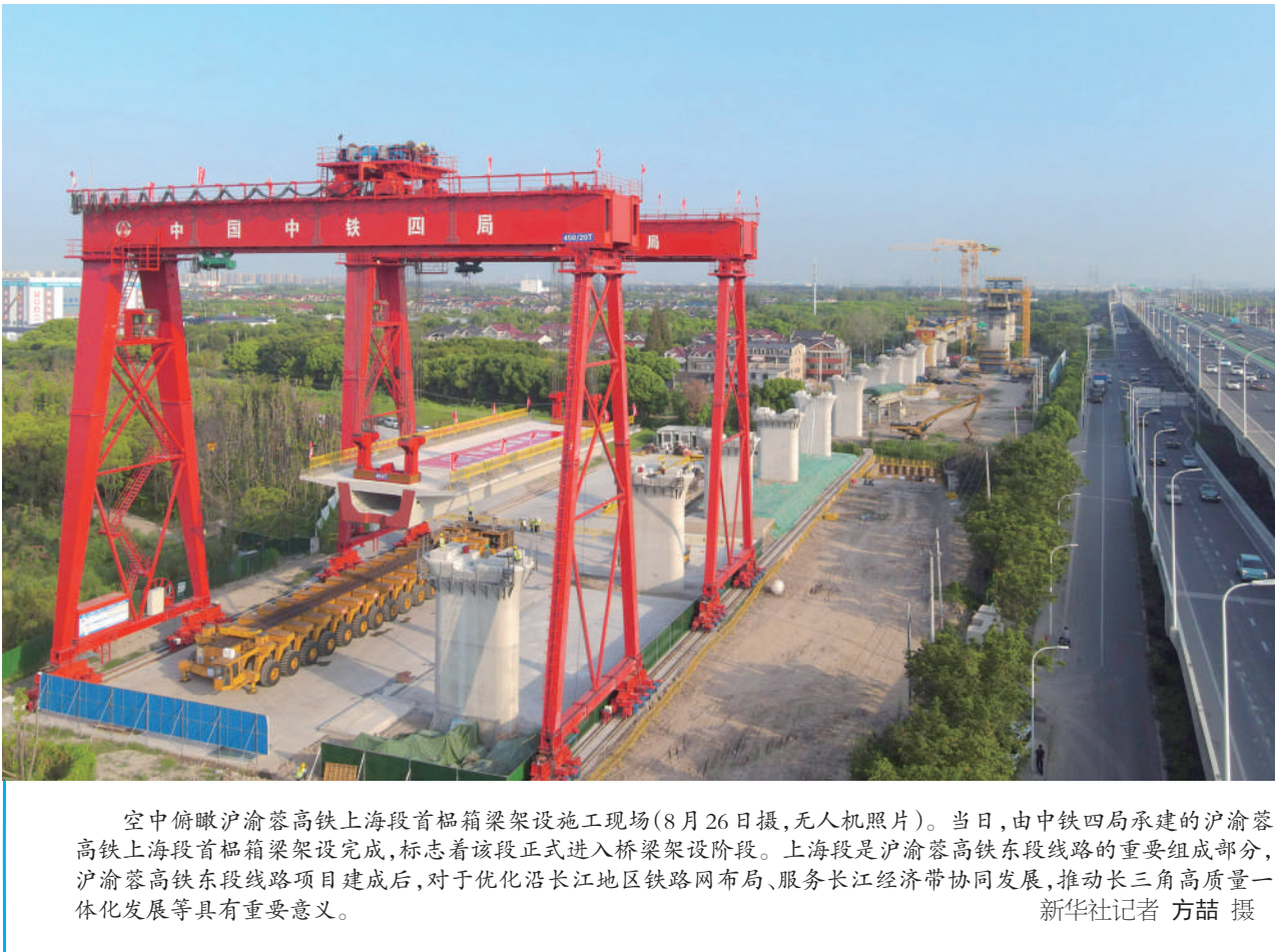
空中俯瞰沪渝蓉高铁上海段首榀箱梁架桥施工现场(8月26日摄,无人机照片)。当日,由中铁四局承建的沪渝蓉高铁上海段首榀箱梁架桥建设完成,标志着该段正式进入桥梁架桥阶段。