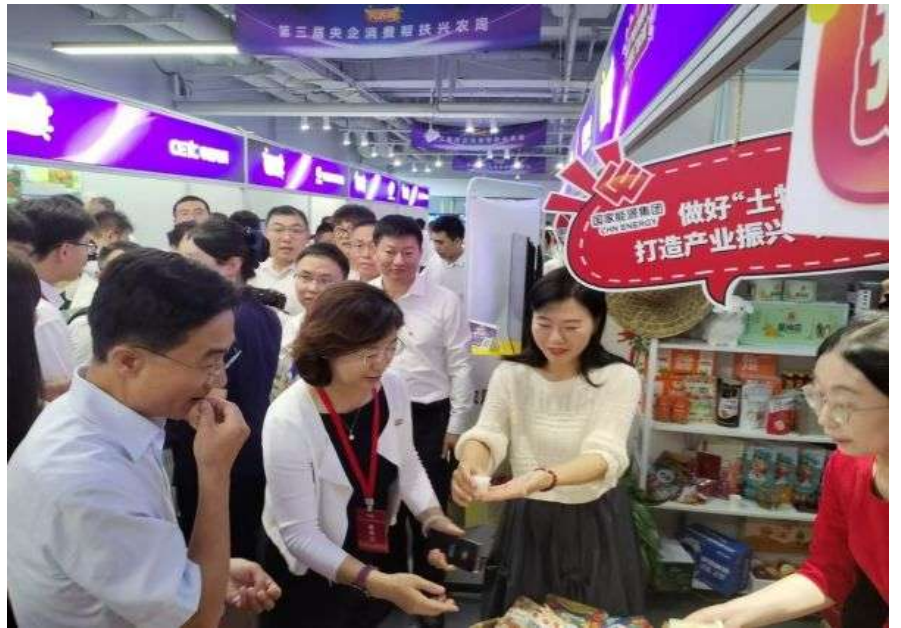
前来品鉴美食、询问产品、洽谈采购的消费者和企业络绎不绝。